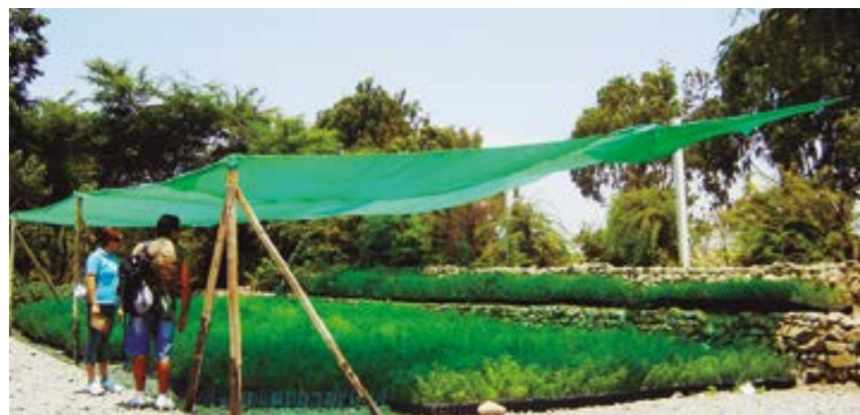
La donación de plántones realizada por el patronato a Chan Chan.

En un recuento rápido de lo que hemos hecho se podría referir la recuperación del Santuario de Huamán, el cual estaba abandonado y era un fumadero de droga; con el apoyo de los integrantes del patronato y de empresas privadas, también en algún momento de la Municipalidad de Víctor Larco, logramos recuperarlo y generar allí lo que se ve ahora. Con la Catedral y el Arzobispado trabajamos proyectos para la iluminación ornamental de estos espacios, logramos que una empresa española —la Fundación Endesa, en ese entonces— nos solvente la ejecución. Para la bienvenida del Papa también intervinimos nosotros y conseguimos una donación de 180