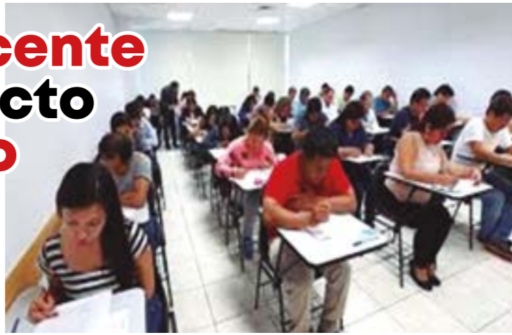
La aprobación de la evaluación debe ser siempre el paso inicial para ingresar a la carrera pública magisterial.

A l cúmulo de errores, torpezas y muestras de incompetencia de la mayoría de congresistas peruanos revestidos del más evidente populismo y demagogia se añade una más. Esta vez la puntería del dardo malévolo de nuestros "padrastrós de la patria" se orientó a la Educación, pues aprovechando que un buen número de peruanos nos encontrábamos atentos al debut de nuestro seleccionado de fútbol, dichos padrastrós, desoyendo la elemental lógica humana, así como las leyes laborales y educativas contenidas en nuestra Constitución Política dieron un duro golpe a la meritocracia docente emitiendo un proyecto de ley que dispone la integración a la carrera pública magisterial de catorce mil profesores que bordean los 65 años de edad desaprobados en la evaluación. Y, lo que es peor, según da a conocer la Vice Ministra de Educación, "careciendo del título pedagógico". Un hecho aberrante existiendo más de 100 mil profesores titulados que aún no tienen plaza y se encuentran a la espera del concurso pertinente para ingresar a la carrera pública magisterial. A esto se añade también la intención de incorporar a sus plazas a 10,700 directores y sub directores desaprobados en concurso.