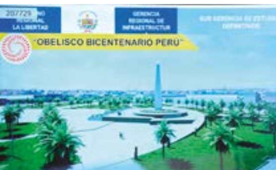
Obelisco del Bicentenario de la independencia de Trujillo.

de conmemoración e izamiento de la bandera nacional en todas las provincias y distritos de la región. Además, que en la currícula escolar se desarrollen temas alusivos a esta importante fecha.