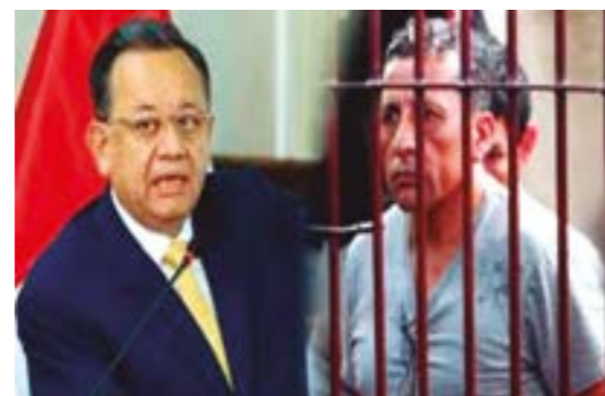
Edgar Alarcón prometió liberar a su líder Antauro Humala

Y es, en este mismo sentido también, que en la Comisión de Constitución del Congreso presidida por Omar Chehade se habría preparado un pre dictamen que al final no prosperó, como tampoco les fue favorable a los congresistas que querían ser reelegidos la consulta hecha por la bancada de APP al Jurado Nacional de Elecciones sobre la eventualidad de la reelección de congresistas tanto del Congreso disuelto, como del Congreso actual.