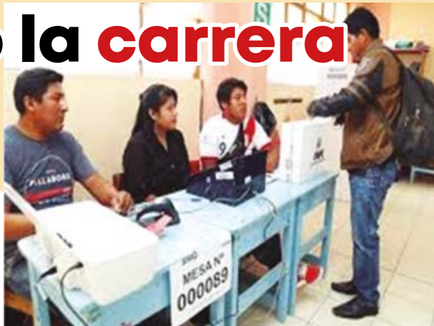
El acto electoral es muestra de responsabilidad cívica.

A escasos seis meses de las elecciones generales del 2021, el pasado 30 de septiembre se dio inicio a la maratónica carrera electoral para ganar el honroso cargo de una curul en el Congreso o la Presidencia de la República. Una carrera, que como ha ocurrido en estos últimos tiempos, tiene la peculiaridad de ser multitudinaria, agitada, demagógica y populista, pero que en esta oportunidad tendrá el agregado de estar rodeada de los últimos adelantos de la tecnología, esto es, empleando la virtualidad: el internet y las redes sociales, en las campañas electorales, pues, ya no se usarán las plazas públicas para los famosos mítines, los que, cuando eran multitudinarios y con un orador persuasivo eran indicadores de triunfo.