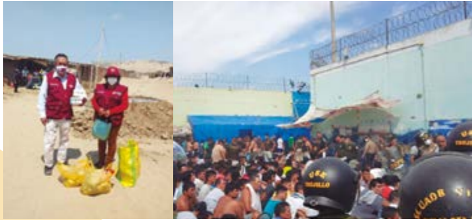
Izquierda: El prefecto realizando labores de proyección social. Derecha: Con efectivos policiales durante el motín en el Penal El Milagro, en marzo último.

Vamos a continuar atendiendo de manera virtual el asunto de las