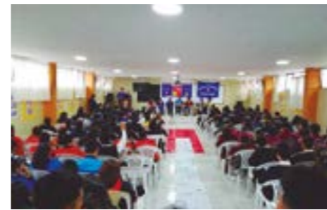
Recital Literario (descentralizado) en la Institución Educativa José Olaya de La Esperanza.