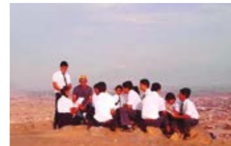
Sesión de poesía en la cima del Cerro Bolongo del Alto Trujillo, con poetas escolares de la I.E. Virgen del Carmen, de ese centro poblado.

esta relevante contribución a la cultura”.