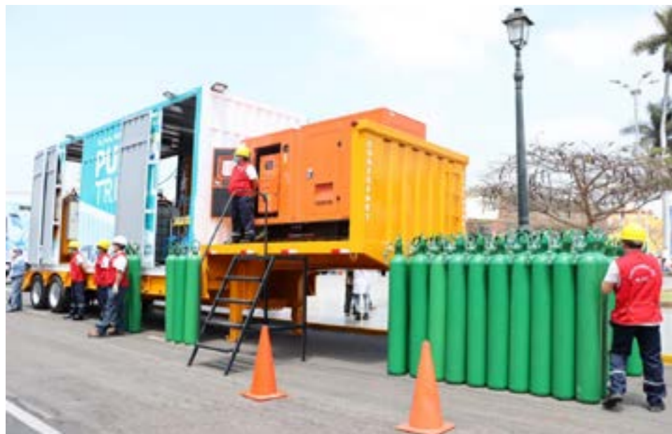
Planta de oxígeno, cuenta con todos los mecanismos suficientes para ofrecer un eficiente servicio a los pacientes que lo requieran.

Se estima que la planta de oxígeno beneficiará a 600 personas diarias. También se adquirió 100 balones de 10 m3 para ser entregados en calidad de préstamo a la población más afectada por la enfermedad. El proyecto tuvo un costo total de 1 millón y medio de soles.