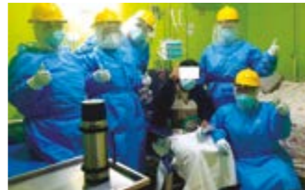
La acción de autoridades y la población consciente lo están logrando.

Además, continúan las campañas de información e identificación temprana de casos y la toma de pruebas moleculares.