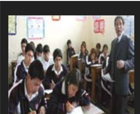
Sólo un profesor capaz es garantía de una buena educación.

Nadie está en contra del sagrado derecho al trabajo de las personas y, es más, a lo largo de muchos años el autor de esta nota ha luchado a nivel sindical por la defensa de los derechos laborales del magisterio; empero, para exigir respeto a nuestros derechos es indispensable cumplir