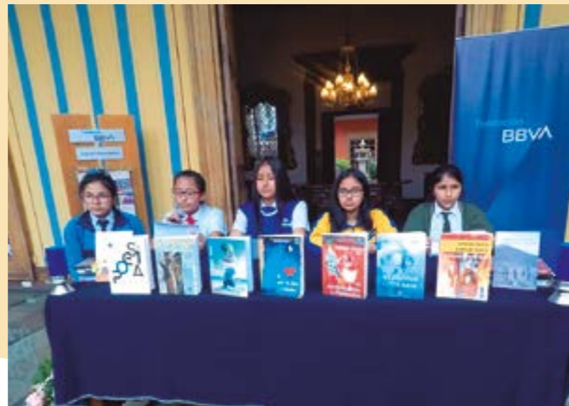
Poetas Escolares y libros publicados a lo largo de 18 años en la dinámica

El importante programa se desarrolla en el área de Cultura de la Municipalidad Provincial de Trujillo.