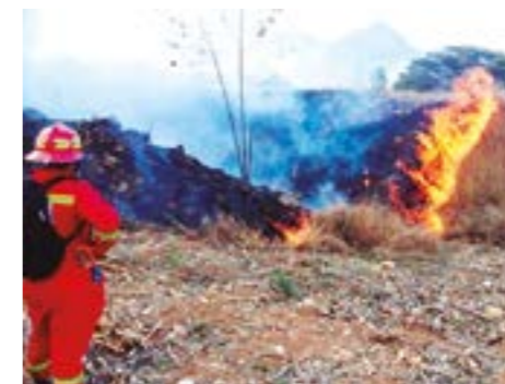
La problemática muchas veces ocasionada por los mismos agrícolas.

La muerte de dos personas —además de fauna silvestre— y dañado más de 700 hectáreas de terreno, plantaciones forestales, espacios de sembrío y naturales es hasta el momento el saldo de treinta incendios forestales sufridos en esta región durante el mes de octubre. Según el Servicio Nacional Forestal y de Fauna Silvestre (Serfor) las emergencias fueron registradas en los distritos de Namora, San Juan, Baños del Inca y Matara, en la provincia Cajamarca; así como en Utcó, Sorochuco y Miguel Iglesias, en la provincia Celendín. Su atención fue coordinada entre el Serfor, los bomberos, el Instituto Nacional de Defensa Civil, las autoridades locales y el Centro de Operaciones de Emergencia Regional. La administradora técnica del Serfor,