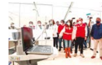
El área cuenta con isotanques de oxígeno, equipos de rayos x, desfibriladores, etc.

Un centro de atención temporal dentro del Hospital Regional Docente con todo el equipamiento necesario para hacer frente a la pandemia fue entregado por el presidente del Consejo de Ministros, Walter Martos, en su última visita a Cajamarca donde desarrolló una intensa agenda