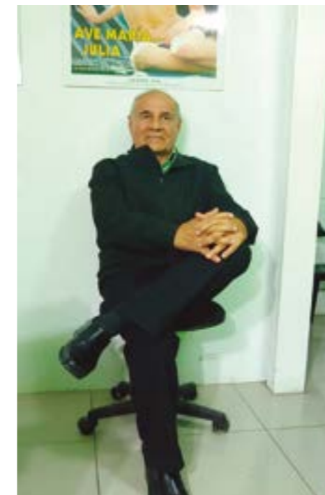
"Nuestros candidatos al congreso, serán profesionales de reconocida trayectoria, que sí trabajarán por el desarrollo de los pueblos de La Libertad."

Tenemos la gran idea de unir Tumbes con Tacna a través de un tren bala, anteriormente se conversó con un grupo de chinos que manejaban la cuestión comercial de la embajada. Básicamente queremos la reforma educativa y de la salud. Necesitamos que haya decencia, honradez y trabajo.