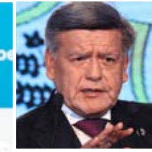
César Acuña Peralta Alianza Para el Progreso