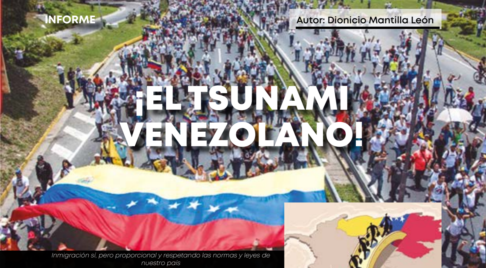
Inmigración sí, pero proporcional y respetando las normas y leyes de nuestro país