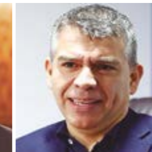
Julio Guzmán Cáceres Partido Morado