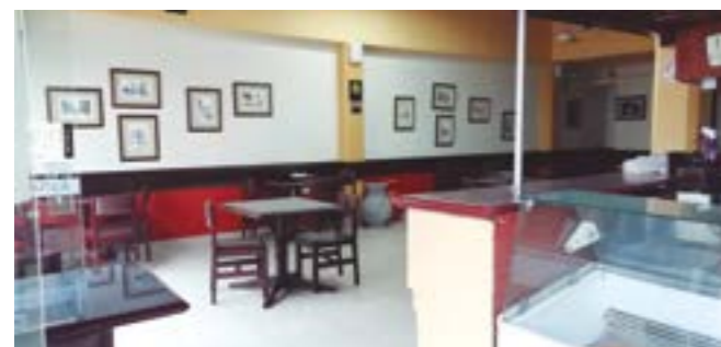
Turistas peruanos, extranjeros y público trujillano, prefieren a Asturias, por su buena atención y calidad en sus platos.

Tiene que haber en el centro mejores playas de estacionamiento, de varias plantas para que los