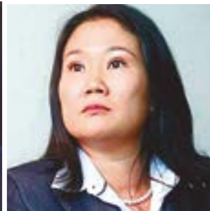
Keiko Fujimori Fuerza Popular