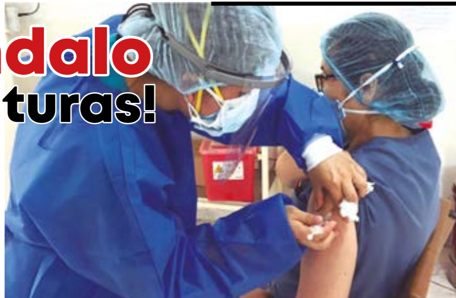
Personal de primera línea: Médicos del Hospital Arzobispo Loayza son los primeros en vacunarse contra la covid 19

La ansiada vacuna contra el covid 19 fue utilizada ilegalmente por autoridades y funcionarios del más alto nivel, provocando un terremoto político que debe ser investigado y sancionado