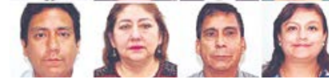
Candidatos al Congreso de la República, del APP que tiene como candidato presidencial a César Acuña Peralta.