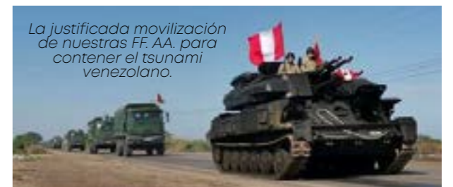
La justificada movilización de nuestras FF. AA. para contener el tsunami venezolano.

salido fuera del país para sacar a los dictadores. Un claro ejemplo es que uno de los últimos corruptos dictadores, Alberto Fujimori, hoy está tras las rejas y hasta cinco ex presidentes de la República, vienen siendo investigados por corrupción e irán a la cárcel. Inmigración sí, pero moderada, que respete las normas y leyes peruanas y no propicie daños a nuestro país!