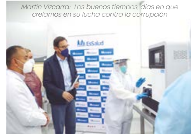
Martín Vizcarra: Los buenos tiempos, días en que creíamos en su lucha contra la corrupción

Y una visible señal de torpeza mayúscula realizada adrede siguiendo el modelo neoliberal de este