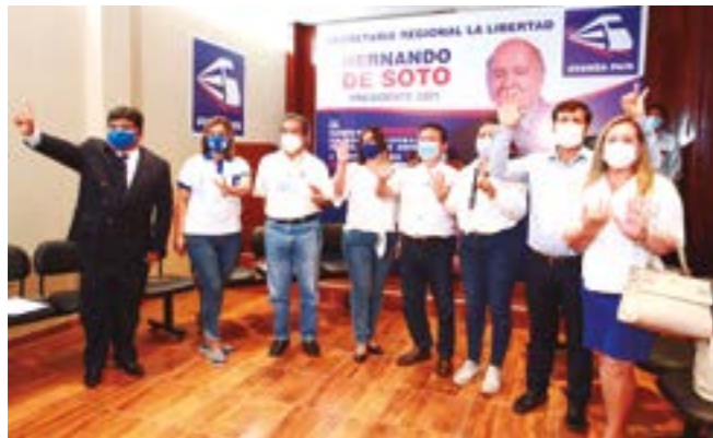
Candidatos al congreso de la República, por el movimiento Avanza País, que tiene como candidato presidencial a Hernando de Soto