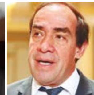
Yonhy Lescano Ancieta Acción Popular