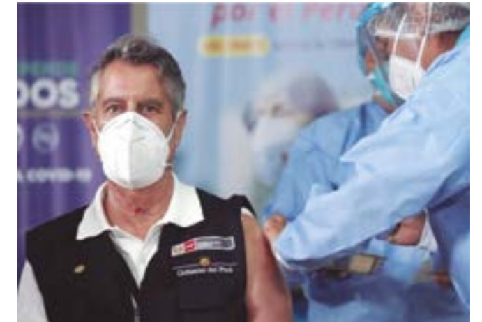
El capitán del barco fue el primero en usar el bote salvavidas a pesar de conocer que le correspondía al personal de primera línea de batalla contra la covid - 19

gobierno, es la de prohibir la brillante iniciativa de los gobiernos locales de la región -liderados por el burgomaestre trujillano José Ruiz-, de adquirir con recursos propios un stock de vacunas para aplicarlas gratuitamente a los pobladores, y también autorizar a las empresas privadas a la compra de las mismas, para venderlas, como suponemos, a precios leoninos. "La ley dice que se autoriza la participación del sector privado con la condición de que el precio no sea mayor al que ofrece el sector público", ha dicho el Ministro de Salud, Óscar Ugarte. Pero, ¿no se ha dicho hasta la saciedad que la vacuna será aplicada gratuitamente por el Minsa? ¿en qué quedamos? ¿es o no una torpeza? ¡Sí lo es, señor Sagasti! ¡afectar los bolsillos del pueblo para llenar los bolsillos del empresariado privado, no está bien! Significa un neoliberalismo puro.