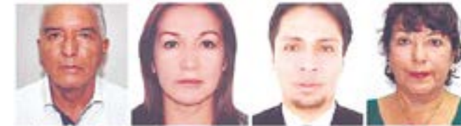
Candidatos al Congreso de la República, del movimiento Victoria Nacional que tiene como candidato presidencial a George Forsyth