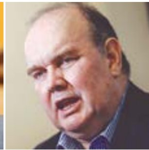
Rafael López Aliaga Renovación Popular