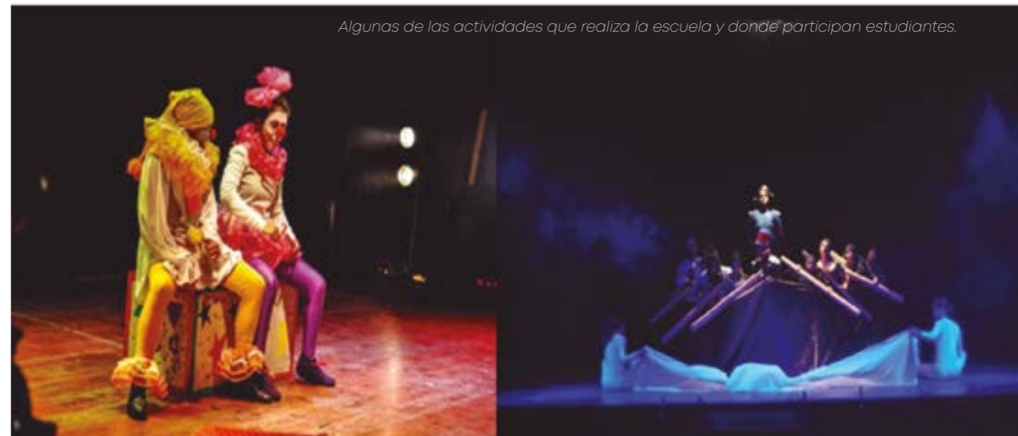
Algunas de las actividades que realiza la escuela y donde participan estudiantes.

En un primer momento hubo profesores que pusieron resistencia porque pensaban que la pandemia iba durar dos meses, sin embargo, inevitablemente tuvieron que capacitarse. Los más jóvenes captaron más rápido... hay profesores que tienen sus años en la escuela y para ellos ha sido un poco duro. Les agradezco y felicito pues al final tuvieron que