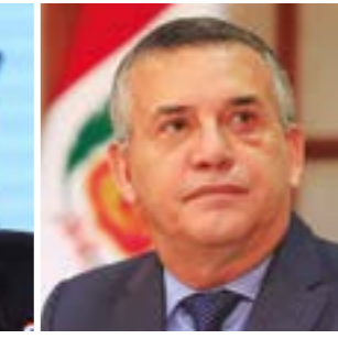
Daniel Urresti Podemos Perú