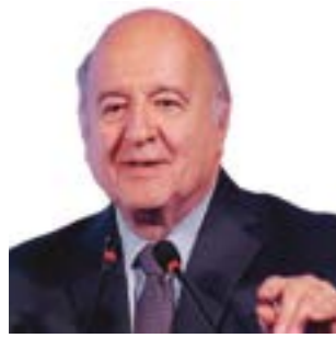
Hernando de Soto Avanza País