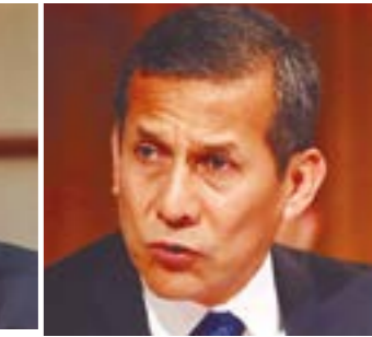
Ollanta Humala Tasso Partido Nacionalista