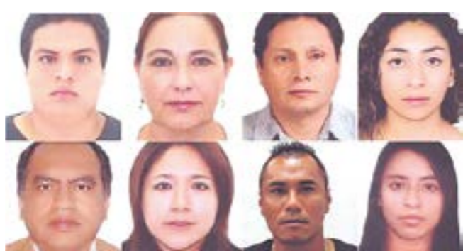
Candidatos al congreso de la República, por el movimiento Renovación Popular, que tiene como candidato presidencial a Rafael López Aliaga.