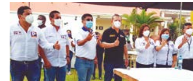
Candidatos al Congreso de la República, del movimiento Podemos Perú que tiene como candidato presidencial a Daniel Urresti