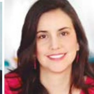
Verónica Mendoza Frisch Juntos por el Perú