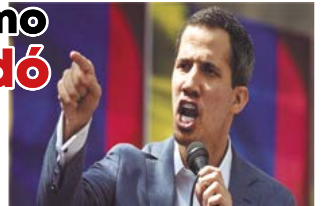
Juan Guaidó protesta hace años desde el extranjero y apoya la huida de sus compatriotas.

En el Perú nuestros líderes democráticos jamás han