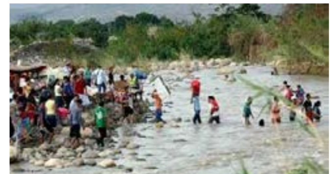
De 500 a 800 venezolanos ingresan diariamente de manera ilegal por nuestra frontera.