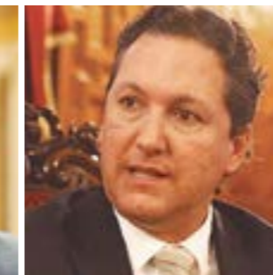
Daniel Salaverry Somos Perú