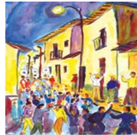
En la composición musical el autor exalta las tradiciones y costumbres de su pueblo natal.