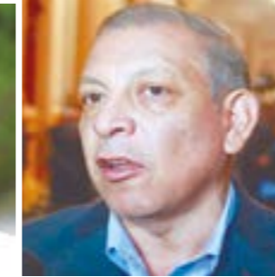
Marco Arana Zegarra Frente Amplio