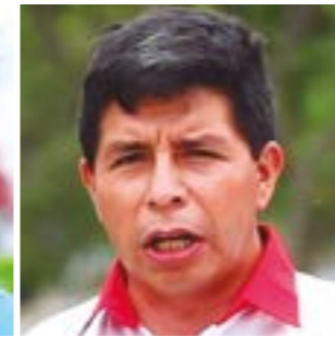
Pedro Castillo Terrones Perú Libre