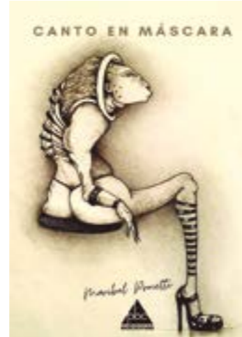
Portada del poemario.