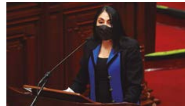
Exministra de Relaciones Exteriores, Elizabeth Astete,

por infracción constitucional, en un juicio político previsto en el primer párrafo del artículo 100 de la Constitución, se adopta con la votación favorable de los 2/3 del número de miembros del Congreso, sin participación de la Comisión Permanente".