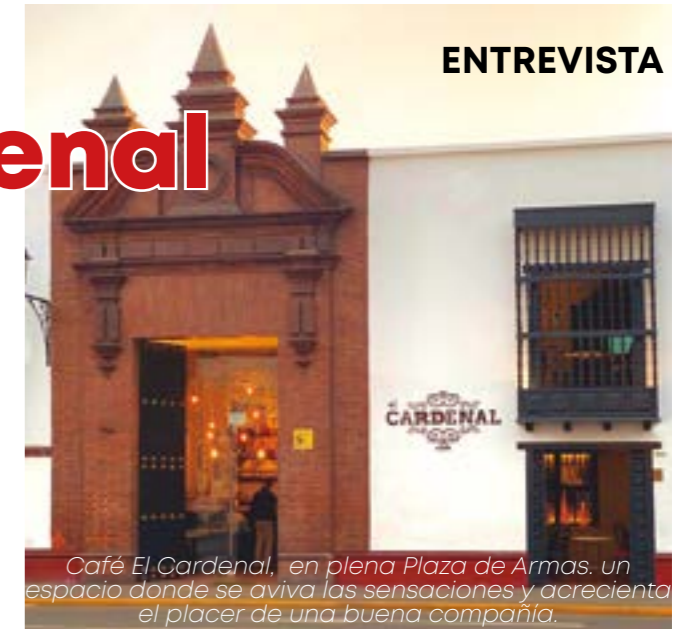
Café El Cardenal, en plena Plaza de Armas: un espacio donde se aviva las sensaciones y acrecienta el placer de una buena compañía.

Una de las fortalezas de nuestro local es su vista de la Plaza de Armas. Lugar de la independencia que en sí mismo ya tiene una fuerte carga histórica. Los trujillanos y turistas pueden disfrutar, mientras se toman un café, o un vino, de una hermosa vista panorámica de la plaza. Normalmente no lo