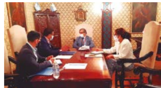
El gobernador regional, con el ministro de Salud, Oscar Ugarte.

y progresivamente hasta el mes de junio, semanalmente, hasta vacunar a más de 44 mil adultos mayores de 80 años", dijo la autoridad. Gracias a que en La Libertad contamos con ultracongeladoras, se ha conseguido que envíen las vacunas Pfizer, que son las de mayor efectividad en el mundo. Adicionalmente se podrá seguir avanzando con otro tipo de vacunas que vayan llegando al país. "Ese es el compromiso del ministro de Salud, Oscar Ugarte", señaló.