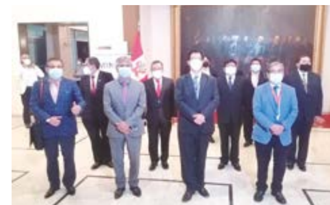
Manuel Llempén, en la capital de la República, exigiendo mayor número de vacunas.

26 millones de soles para contratar y reforzar al personal CAS-covid-19 en el I, II, y III nivel de salud, es decir postas, centros de salud y hospitales; $/16 millones para la continuidad hasta junio del personal contratado durante la pandemia; y 44 mil vacunas Pfizer para inocular a nuestros adultos mayores consiguió en Lima el gobernador regional Manuel Llempén Coronel. "Las vacunas llegarán a partir de mayo