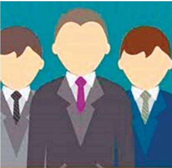
Viene de la Pag. 5

a ello, poseer las cualidades de un verdadero líder y estadista: madurez, coraje, iniciativa; asimismo, humildad, tolerancia, ecuanimidad y sensatez para afrontar con éxito los pequeños y grandes problemas y contingencias de la Patria y, sobre todo, amor por ella. Si Ud., luego de la información que la prensa cumplió con brindarle, encontró al candidato o candidata ideal sea para Presidente o Presidenta o para congresista, en buena hora. De su decisión depende ahora, gozar de cinco años de bienestar con bonanza económica, empleo, seguridad, servicios de educación y salud de calidad y libre de corrupción como resultado del correcto desempeño de un o una gobernante idóneo o, en su defecto, sufrir los efectos de una mega crisis que llevará al colapso a nuestra patria.