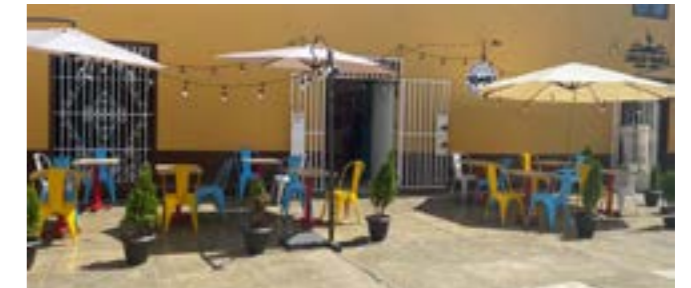
Fuente de Soda, Robin's, un local ubicado en la plazuela La Merced, donde la vida se hace más hermosa.

Es un lugar especializado en waffles, shakes y hamburguesas. También en lo clásico como son los desayunos típicos trujillanos. Es una comida más ligera. Cuenta con una amplia y extensa terraza al aire libre, con una vista también muy bonita, que genera mucha tranquilidad, muy apropiada para estos tiempos de