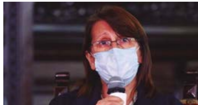
Exministra de Salud, Pilar Mazzetti,

El inciso i) del artículo 89 del Reglamento, que posee fuerza de ley, define que "el acuerdo aprobatorio de sanción de suspensión, inhabilitación o destitución