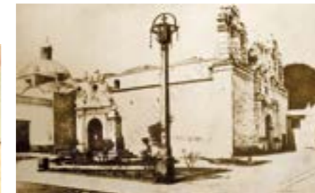
Foto antigua de la iglesia La Merced