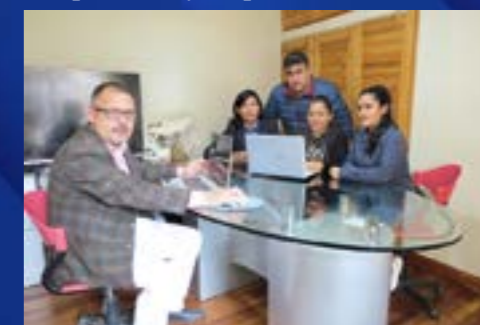
Los profesionales de la SG Empresa & Consultoría SAC en plena labor ejecutiva