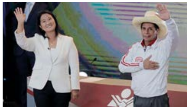
Último debate entre Pedro Castillo y Keiko Fujimori

Además del reto de enfrentar la pandemia y de