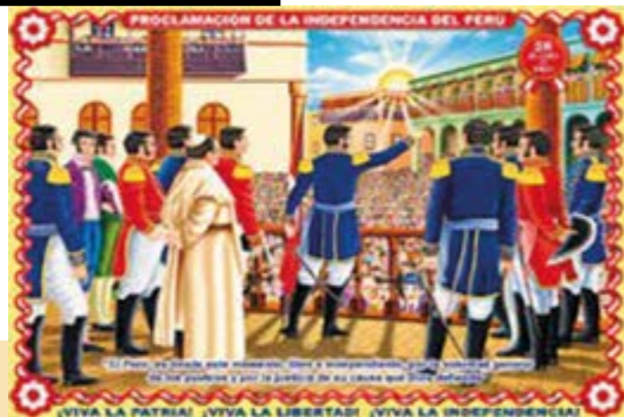
Un país libre, justo y desarrollado.

Al arribo de los 200 años de nuestra independencia y al inicio de un nuevo gobierno, los peruanos expresamos nuestro saludo y compromiso de seguir construyendo