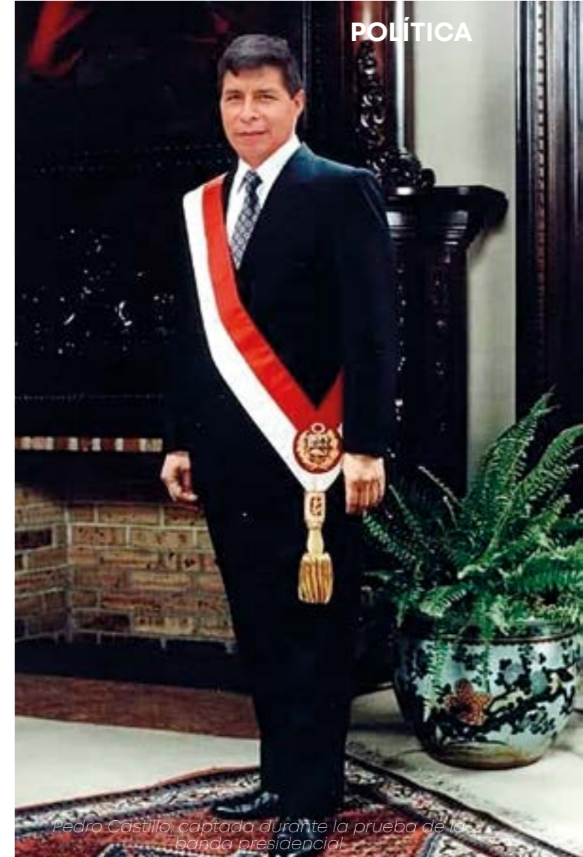
Pedro Castillo, captada durante la prueba de la banda presidencial

En su plan de gobierno asegura que su propuesta "recoge la esperanza de cambio de los pueblos y se afirma en un camino de cambio progresivo pero profundo, verdaderamente democrático, guiado por la búsqueda de derechos y oportunidades para todos y todas, con justicia y paz". El presidente peruano finaliza el documento del plan con la frase: "¡Palabra de Maestro!" para ganarse la confianza de sus votantes.