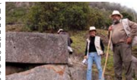
Walter Alva y la arqueóloga Emma Eyzaguirre Coronado, en el complejo arqueológico Poro Poro, Cajamarca.

Por su parte, Walter Alva agradeció el reconocimiento brindado por las autoridades y la ciudadanía. Walter Alva es uno de los arqueólogos más destacados en el Perú. El descubrimiento de la llamada "Tumba del Señor de Sipán", ha hecho su nombre mundialmente conocido, al considerarse entre los más importantes descubrimientos del siglo XX.