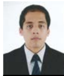
Autor: Oscar Eduardo Alquízar Deza

Semblanza del pensamiento y la acción política del solitario de Sayán