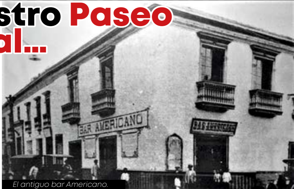
El antiguo bar Americano.

Debido a esta pandemia que nos impide de hacer viajes largos y prolongados, sigo con el propósito de continuar valorando lo que tenemos cerca de nosotros y que muchas veces no le damos la importancia debida. En esta oportunidad me propuse recorrer y "mirar con ojos turísticos" las cuatro cuadras del céntrico jirón Pizarro,