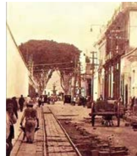
calle del Mirador de Santa Clara (Cda.7). Nótese la pared del monasterio.