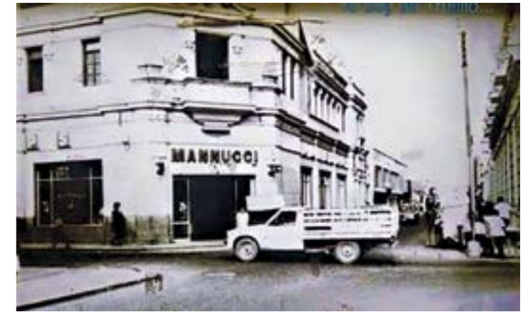
Antigua casa comercial Mannucci,

la de Pizarro con Gamarra, la Casa de la Emancipación, quizás la casona con más historia de Trujillo. De estilo republicano, luce una sobria fachada con una amplia portada coronada con timpano triangular. Es flanqueada con sobrios balcones de antepecho de fierro fundido y elegantes ventanas voladas con repisas, rejas y conopeos que caracterizan a la arquitectura trujillana. En la esquina opuesta, la de Pizarro con Junín, se halla el elegante Palacio Iturregui, réplica de un palacio florentino. Su fachada es de estilo neoclásico con columnas adosadas de órdenes jónicos y corintios. La pared principal presenta un decorado que se le conoce como almohadillado. En el segundo piso se aprecian siete balcones de antepecho con artísticas barandas de fierro forjado. Las dos grandes ventanas, en su parte superior, presentan las únicas coronaciones de la ciudad conocidas como "peinetas", características de la arquitectura lambayecana de donde provenía su