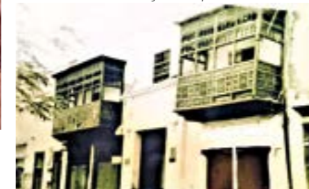
Antigua casona Lavalle, con sus dos balcones hoy desaparecidos