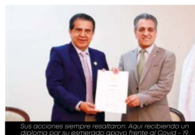
Sus acciones siempre resaltaron. Aquí recibiendo un diploma por su esmerado apoyo frente al Covid - 19.

Fue presidente del CREEAS desde diciembre del año 2017, desde entonces luchó arduamente con sus