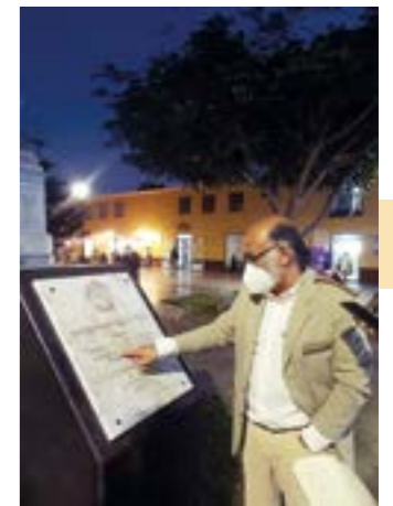
El autor frente a la placa de inauguración del paseo peatonal.

hotel Americano, hoy cerrado. Historiadores sostienen que en ese mismo lugar se ubicaba la casa del marqués de Torre Tagle quien proclamó la independencia de Trujillo en 1820. A su lado, con el N°780, se ubica el inmueble donde antaño funcionó la Oficina de Correos. Hoy es una institución educativa, en su fachada hay un escudo nacional con el año 1907, posiblemente el de su construcción. Y termina el recorrido en