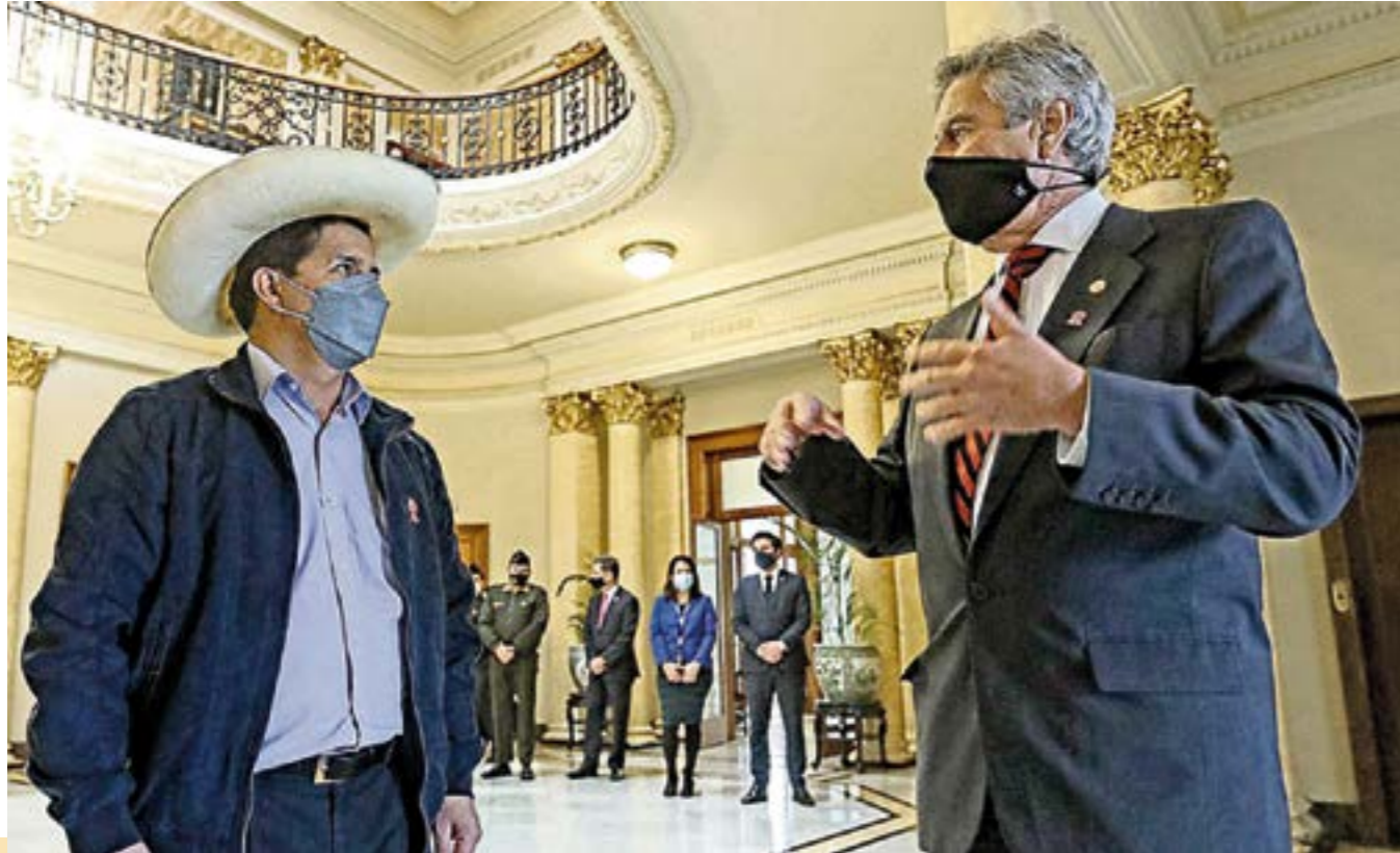
El día que Francisco Sagasti, recibió al presidente Pedro Castillo, en su primera visita al Palacio.

La lucha contra la pandemia, la crisis económica y la gobernabilidad: