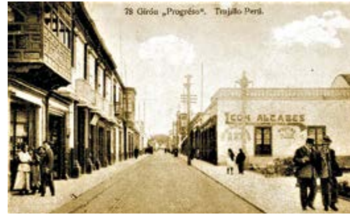
Antigua calle de las Leyes. (cda. 5)

A la siguiente cuadra, la sexta, se la llamó calle "del Comercio" por la cantidad de negocios que había. Actualmente destacan, en ambas esquinas, dos inmuebles representativos de nuestra ciudad. En