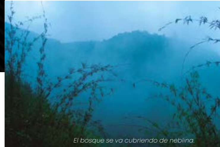
El bosque se va cubriendo de neblina.

pie de la fogata fueron muy agradables, participando de los juegos, contando historias, asando hot dogs y marshmallows, secando la ropa y las zapatillas mojadas... una noche inolvidable para los nuevos guerreros en su primera experiencia campista. La lluvia escampó aproximadamente a las once de la noche e, increíblemente, no llovió una sola gota durante el resto de la noche.