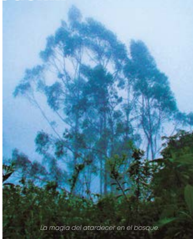
La magia del atardecer en el bosque.