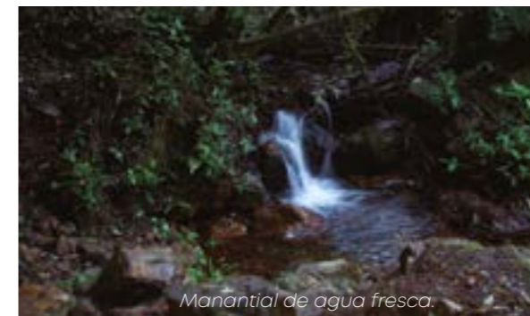
Manantial de agua fresca.

La mañana siguiente un esplendoroso sol, el gran ausente el día anterior, nos acompañó durante toda la jornada. Luego del desayuno, la visita a las cascadas, en la parte inferior del bosque, fue otra buena experiencia y puso a prueba el estado físico de mis nuevos guerreros. El regreso a la "Curva de Chapolán", por el mismo