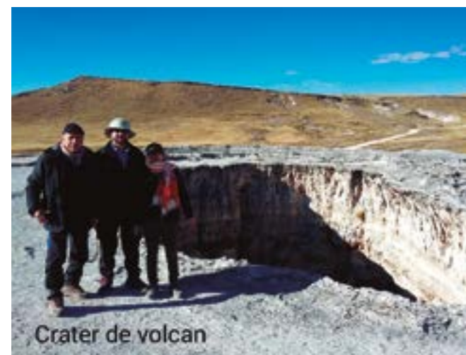
Cráter de volcán

D espués de pernoctar en un hotel en el pueblo de Chipao, partimos a las 4 de la mañana rumbo a Pachapumpum. Nuestro fin era conocer el volcán. Iniciamos el viaje por una carretera fría con una temperatura de 8 grados bajo cero. Carretera que lleva el nombre de Catalina Huanca. A las siete de la mañana llegamos al lugar. La atención al público y turistas empieza a las 9 de la mañana, en el lugar hay un restaurante, aprovechamos para tomar desayuno.