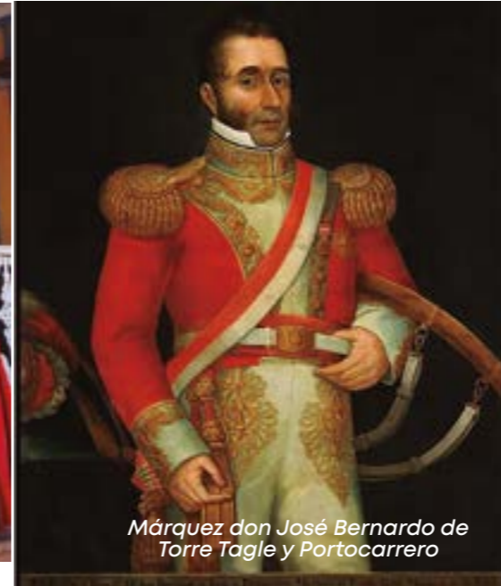
Marqués don José Bernardo de Torre Tagle y Portocarrero

tenemos el mensaje que, en 1820, el Marqués don José Bernardo de Torre Tagle y Portocarrero, dirigió a la mujer contumacina felicitándola por la ofrenda que hizo de sus hijos a la patria. La mujer contumacina aportó, además, con sus alhajas que fueron donadas para obtener recursos cuyos resultados fueron las victorias de Junín y Ayacucho. En la histórica Proclama al Bello Sexo Contumacino, se les da el honroso título de