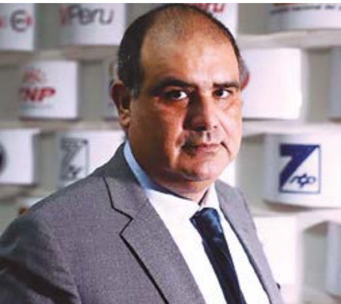
Presidente Ejecutivo de IRT Joseph Elías Dager Alva, con un reto al servicio de los pueblos.

Así lo señala el presidente de Instituto Nacional de Radio y Televisión (IRTP), Joseph Elías Dager Alva.