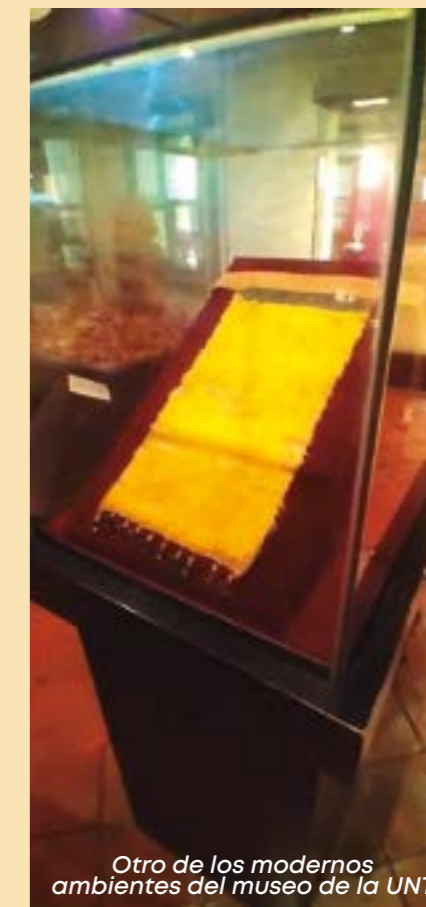
Otro de los modernos ambientes del museo de la UNT

Invitar a la comunidad trujillana para que puedan venir a apreciar este museo que se ha hecho con mucho esfuerzo y no seremos como el Museo Tumbas Reales de Sipán o Sicán, pero hemos logrado con mucha voluntad de trabajo una museografía excelente y aquí la gente tiene que ver dos cosas: el patrimonio arquitectónico de la casona de la época colonial y el patrimonio propio que estamos exhibiendo de una forma muy didáctica.