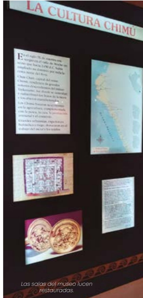
Las salas del museo lucen restauradas.

Tenemos dos series, una se llama “Arqueología y Vida” y estamos publicando sobre la vida de algunos arqueólogos peruanos que han hecho un trabajo extraordinario y nos hemos quedado en el Número 5; la otra serie es “Arqueología y Vida de peruanistas del siglo XX”, es sobre extranjeros que trabajaron aquí y se les está dando un homenaje muy especial. Creo que, a nivel del norte, uno de los museos que más ha publicado en estos años es este.