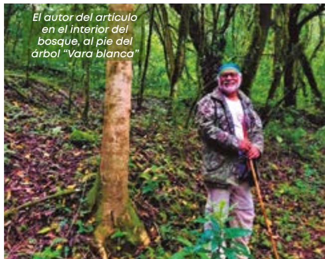
El autor del artículo en el interior del bosque, al pie del árbol "Vara blanca"

Que la pandemia de la covid-19 nos ha marcado la vida, no me cabe la menor duda. A mí me ha limitado y hasta impedido mis viajes de aventura y campamentos durante todo este tiempo. Pero Dios que es grande me permitió hace pocos días que, en compañía de veinte guerreros y con todas las precauciones del caso, pudiera yo regresar al más enigmático bosque del norte peruano. Un bosque, felizmente de propiedad privada, que recientemente ha sido declarado como Área de Conservación Privada por el SERNANP; un gran logro de la familia Corcuera García. Encerrado entre sus cerros guardianes, el Condorcucho, Cunanten, Loma Limpia, Luden y Palo Blanco, en la frontera entre las provincias de Gran Chimú (La Libertad) y la de Contumazá (Cajamarca) se halla este bosque de neblina de 210 hectáreas, como una isla en medio de otras áreas cultivadas. Cachil es un bosque relicto, de "aquellos que quedan como vestigio de algún tipo de flora que alguna vez hubo en la zona". También se lo puede calificar como "bosque primario" pues nunca ha sido talado. Puedo asegurar que los añejos árboles de Cachil, si hablasen, nos narrarían la historia del Perú. En él se han hallado hasta seis especies de nuevas plantas para el mundo y tiene muchas especies endémicas de flora y de