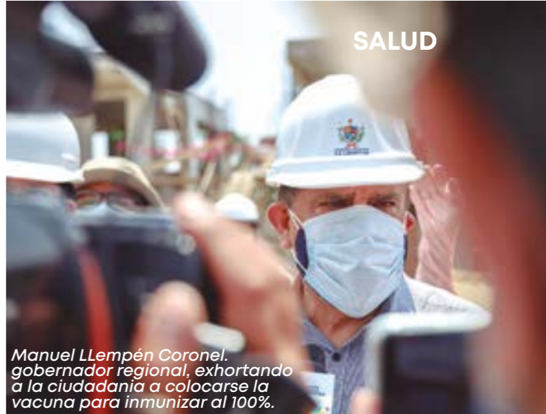
Manuel Llampén Coronel, gobernador regional, exhortando a la ciudadanía a colocarse la vacuna para inmunizar al 100%.

Según la Sala Situacional covid-19, el pasado miércoles 19 hubo 279 personas hospitalizadas —entre positivos y sospechosos—, 4 fallecidos y 973 nuevos contagiados, sumando un total de 139,035 casos en lo que va de la pandemia, incluyendo reinfecciones. El uso de camas se ha triplicado respecto a cinco semanas atrás. De cada 10 hospitalizados 7 o no han tenido vacuna o solo recibieron la primera dosis. "Ahora hay muchos contagios en niños y ellos no salen solos a la calle, entonces somos los mayores quienes los estamos contagiando. Hay que tener muchísimo cuidado", insistió Llampén. En el Hospital Regional Docente, de un total de 45 camas UCI-Covid, 37 estaban ocupadas y quedaban