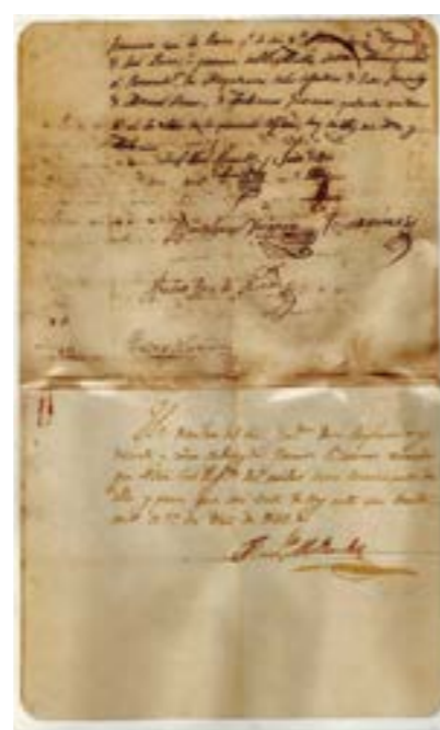
Valiosos documentos inéditos e históricos: Carta de puño y letra enviada por el Marqués don José Bernardo de Torre Tagle y Portocarrero a las damas contumacinas por valioso apoyo para cristalizar la independencia de Trujillo y del Perú

que terminó con el periodo colonial en la región se inició en la ciudad de Trujillo entre el año 1820 y 1821. Fue importante debido a que se independizó del gobierno español a casi todo el norte peruano porque la antigua Intendencia de Trujillo albergaba dominio sobre las actuales regiones de Tumbes, Cajamarca, Amazonas, Piura, Ancash, San Martín y Lambayeque. Además fue un acontecimiento vital que contribuiría luego a la independencia del Perú del