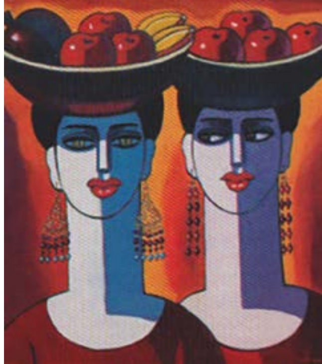
Cuadros realizados en diferentes etapas del artista.