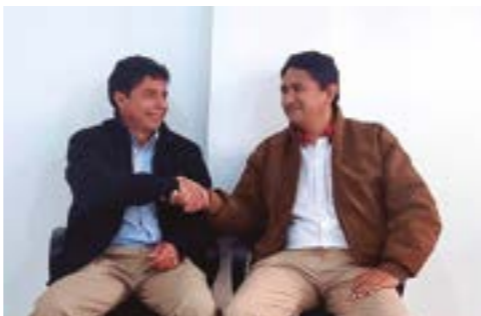
Ambos investigados por corrupción

¡Pero, lamentablemente allí están, también, quienes destruyen nuestras ilusiones y esperanzas! Allí, puestos en los paredones de nuestra condena, los gobernantes y funcionarios corruptos que desde hace más de tres décadas vienen estigmatizando