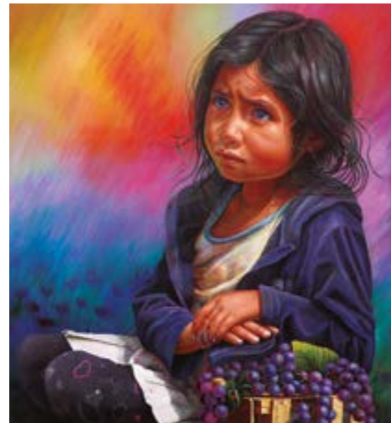
"Sueño interrumpido", óleo de la artista plástica, Carolina Carranza

GERMÁN: En mi caso trabajo un poco más lo que es tratar de coger una expresión en un determinado momento y extraerla para poder reflejar algo. También tiene que ver mucho con lo social. Por ejemplo, en uno de mis cuadros "Nueva realidad" quise tocar lo que se está viviendo hoy en día: se trata de una obra que está estilizada y simplificada, un tanto abstraída. Los ojos están tan grandes porque es lo que más se ve actualmente. También trabajo el paisaje, que me gusta, pero siempre