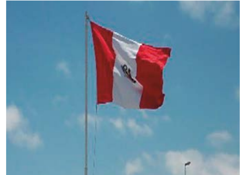
Nuestra bandera, roja y blanca, flameando en todo su resplandor, en señal de la Independencia del Perú

Denegri Luna, Félix; Vélez SJ, Armando Nieto; Tauro del Pino, Alberto y Durand Flórez, Luis (1972). Antología de la Independencia del Perú. Lima. Tauro, Alberto (1971). Los Ideólogos: Plan del Perú y otros escritos. Colección documental de la independencia del Perú. Lima.