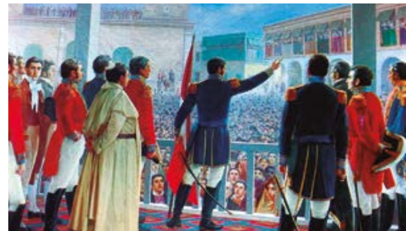
"¡El Perú es libre e independiente por la voluntad general de los pueblos!"

Arribamos al 201 aniversario de la independencia de nuestra amada patria: 28 de Julio de 1821! Histórica fecha que conmueve nuestro ser. Son más de dos centuriavividas intensamente al calor del indeclinable coraje y perseverancia de nuestros connacionales, sobre todo, de quienes derramaron su sangre en pos de construir una Patria grande y próspera sobre los pilares de la fraternidad, la democracia, la libertad y la independencia. 201 años de ir tras nuestros sueños, muchos de ellos alcanzados, pero, otros no, debido a las tenebrosas nubes de la corrupción y la incapacidad de los malos gobernantes! ¡Años de usufructo de nuestra riqueza natural -generoso legado de nuestro Divino Creador-, la que tenemos la obligación de incrementar para construir la acerada unidad nacional y defenderla cuando la ambición extranjera ose poner sus garras sobre ella! ¡Hoy, en este mes de la Patria en que el territorio nacional se viste de gala y se adorna de preseas y laureles, hoy, que orgullosos izamos la bandera y cubrimos de rojo y blanco nuestro ser, y doradas lágrimas de amor patrio bañan nuestras almas, hoy hacemos un alto para renovar nuestra promesa de eximirla de tiranías y totalitarismos, siempre libre y grande, siempre justa y siempre digna! ¡Tengo el orgullo de ser peruano y soy feliz, de