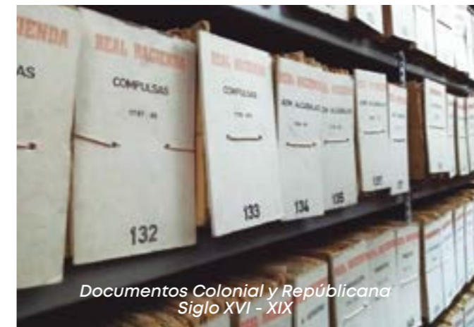
Documentos Colonial y Republicana Siglo XVI - XIX

Como no tengo secretaría, pues yo me hago cargo de calificar la documentación para Registros Públicos, porque hay muchos documentos, de todos los notarios,