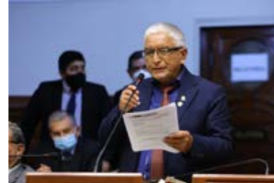
Congresista Héctor Acuña Peralta, presidente de la Comisión de Presupuesto y Cuenta General de la República.

En tanto, los parlamentarios Carlos Alva Rojas (Acción Popular) y Diego Bazán (Avanza País), representantes de La Libertad coincidieron con los puntos de vista expresados por sus colegas parlamentarios libertinos Magaly Ruiz y Héctor Acuña Peralta.