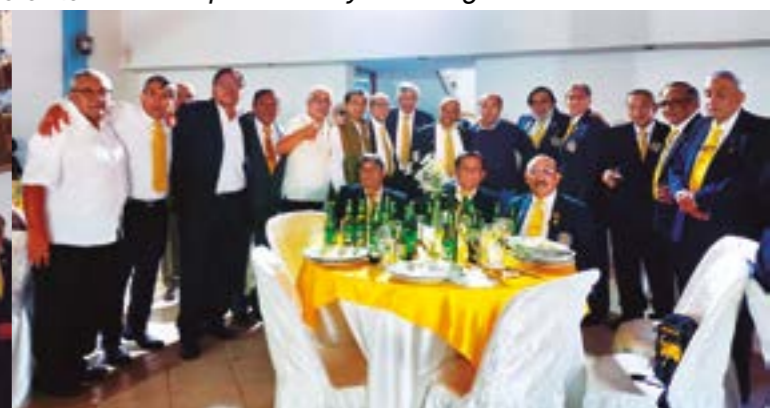
Ceremonia Litúrgica donde participaron los asistentes a los actos de las Bodas de Oro.