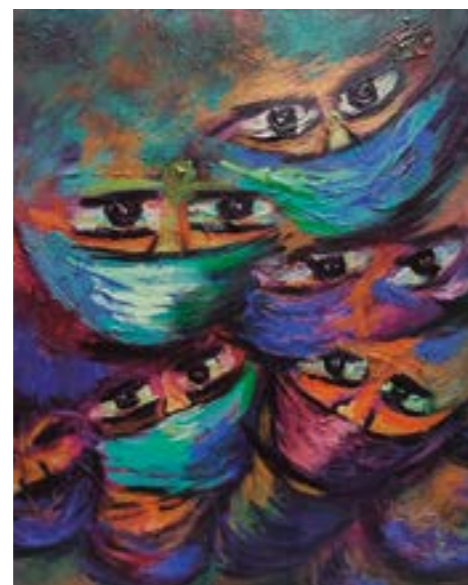
"Nueva realidad", obra artística de Germán Ruiz Villanueva.

pasan muchas mujeres. Sabemos que del cien por ciento, al menos el 90 ha sufrido algún tipo de violencia, entonces mi obra quiere representar a una joven que ha sido violentada, porque una vez que te tocan quedas marcada. Se llama así por eso, porque se quedó ahí, marcada para toda la vida.