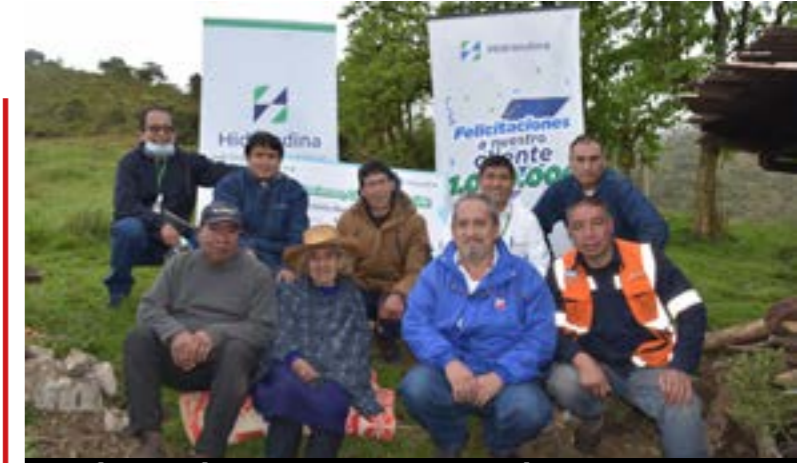
Predio se ubica en las alturas de Cajamarca:

En la historia del Perú, desde que se instauró la democracia y por legítima voluntad del pueblo no hay gobernante que haya estado cinco periodos consecutivos en un cargo del estado, como lo hizo José Murgia Zannier, como alcalde de Trujillo. Y sin duda lo más importante que durante sus periodos de trabajo tanto en la Municipalidad Provincial de Trujillo, como en el Gobierno Regional de La Libertad y el Ministerio de Transportes y Comunicaciones, lo hizo en forma transparente y dedicado al desarrollo y engrandecimiento de los pueblos, dando como resultado que hoy en día salga por las calles y recibe baños de popularidad tanto de la población como de taxistas que desde su vehículo le tocan claxon como símbolo de saludo, respeto y adhesión. Esto sin duda, es admirable, puesto que son pocas las autoridades que son recordadas con tanto cariño.