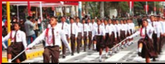
La juventud peruana tomará la posta para construir una nueva Patria