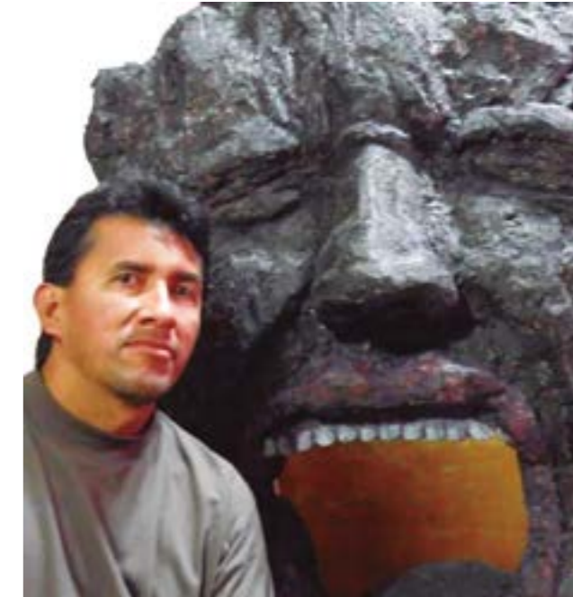
Hermosa escultura "El Grito" una de las más representativas del artista German.

Germán: Nosotros, como asociación, somos un equipo de trabajo multidisciplinario por la pandemia nos detuvimos, pero hemos retomado el