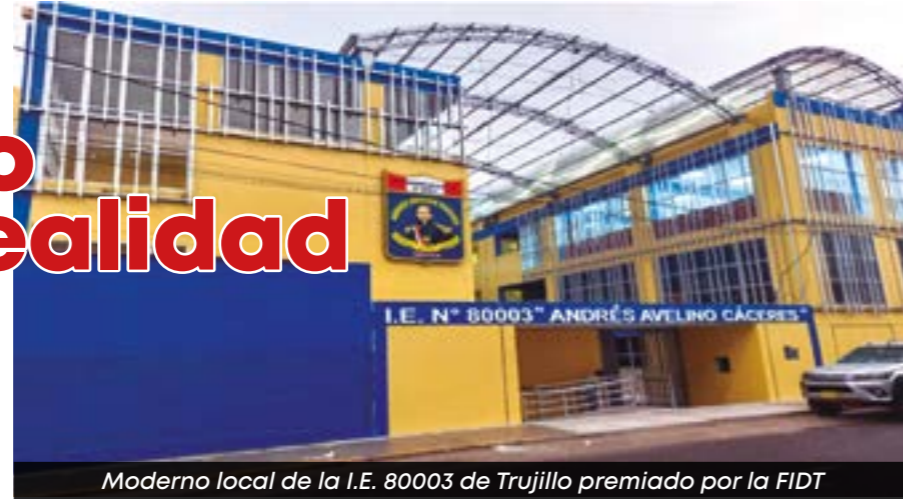
Moderno local de la I.E. 80003 de Trujillo premiado por la FIDT

autoridad regional hizo hincapié en su compromiso con el mejoramiento de la calidad educativa de la región señalando que a lo largo de su gestión tiene planificado el mejoramiento de 100 locales escolares siendo uno de