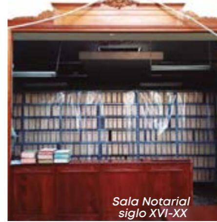
Sala Notarial siglo XVI-XX

Un proyecto que tuvimos y ya se dio la ordenanza regional es la digitalización de documentos históricos. Los expedientes tienen siglos y su mantenimiento es muy delicado. Entonces ése es el caso, queremos hacer ese escaneo de documentos, pero no podemos por el presupuesto limitado.