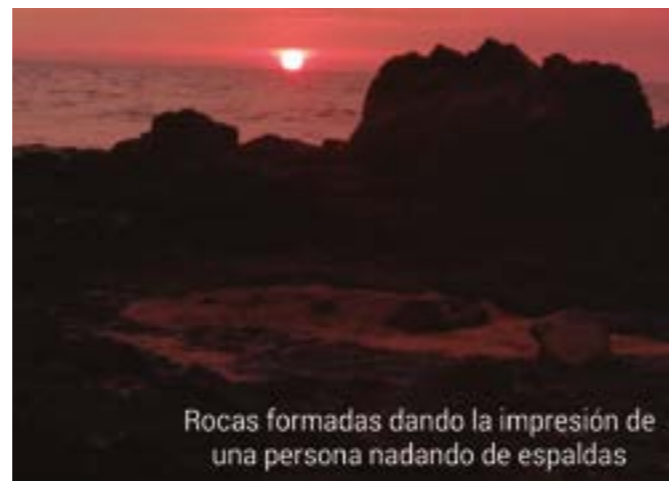
Rocas formadas dando la impresión de una persona nadando de espaldas

apresado por las rocas entre las olas del mar. Esta nave había encallado, no podían recuperarla. También apreciamos el hermoso atardecer donde se formaban escurridizas formas con las nubes y los últimos rayos iluminaban la tarde frente al mar.