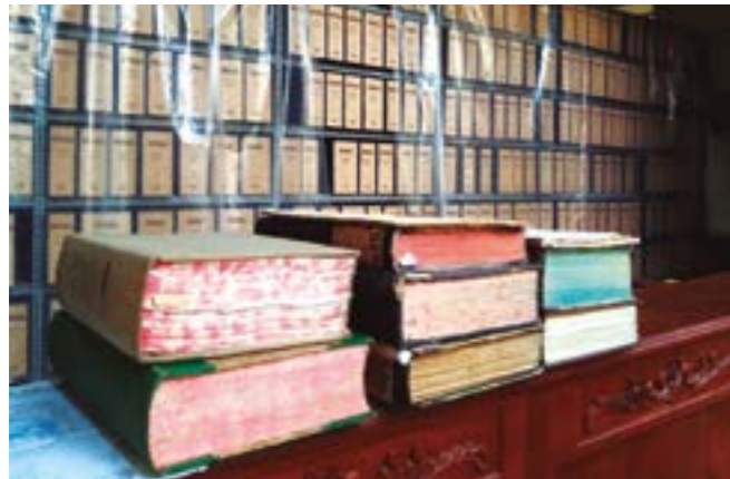
Documentos de la Sala Notarial del Siglo XVI - XX

Surge de acuerdo a la ley N°19414 para la conservación de documentos. Esa ley fue dada en 1972, pero ya existía el Archivo General de la Nación en Lima, luego se forman los Archivos Departamentales. Primero fue el de Arequipa, después el de Trujillo y así sucesivamente.