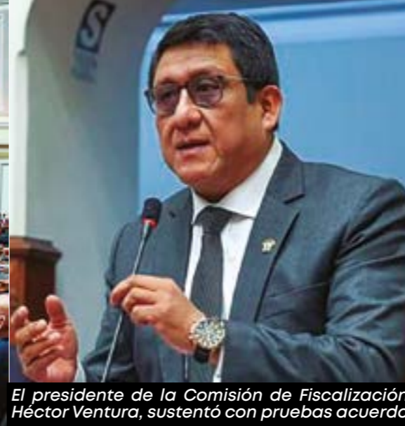
El presidente de la Comisión de Fiscalización, Héctor Ventura, sustentó con pruebas acuerdo.