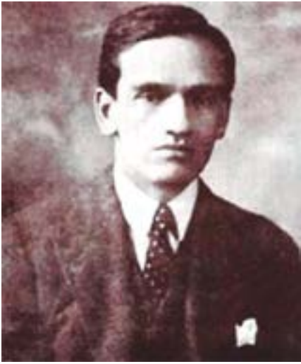
El inmortal poeta César Vallejo fue profesor en el Colegio San Juan, siendo uno de sus alumnos el célebre escritor Ciro Alegría Bazán.