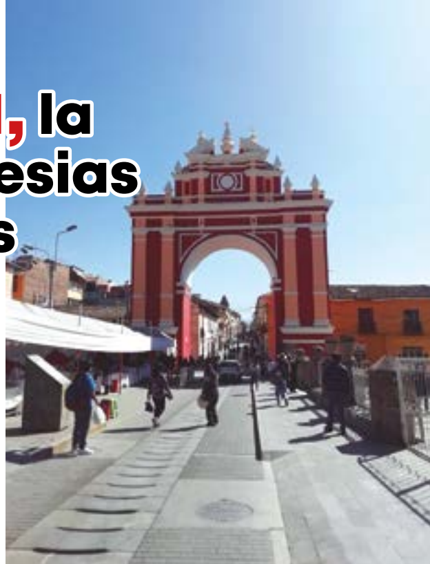
El Arco de triunfo.