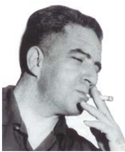
Ciro Alegría, reconocido novelista autor de la famosa obra "El mundo es ancho y ajeno", estudió en las aulas canarias.