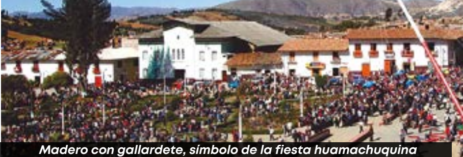
Madero con gallardete, símbolo de la fiesta huamachuquina

La cuna de Sánchez Carrión recuerda sus 469 años de fundación venerando a su patrona religiosa, la virgen de "Alta Gracia"