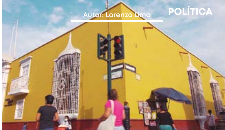
Riva Agüero tras disolver el congreso se trasladó a Trujillo y en la Casa de la Emancipación, estableció un Senado integrado por 10 vocales elegidos entre los diputados. De esta manera Trujillo se convirtió en sede de la primera sesión descentralizada del Congreso