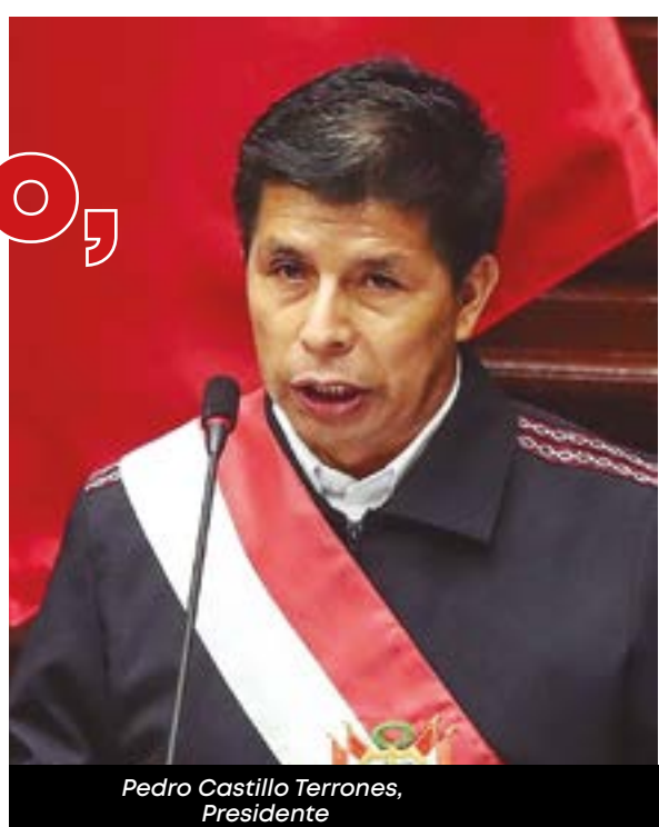
Pedro Castillo Terrones, Presidente

A pesar que el Perú ha liderado por muchos años el crecimiento económico en América Latina, ha sido cuna en las últimas tres décadas, de ex gobernantes corruptos y, actualmente, del presidente Pedro Castillo Terrones. El profesor José Pedro Castillo se convirtió, el 28 de julio de 2021, en el Presidente de la República número