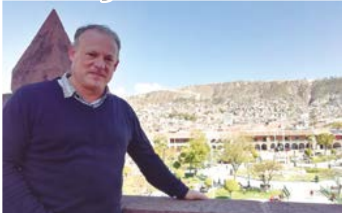
La Plaza de Armas vista desde el campanario de la catedral.