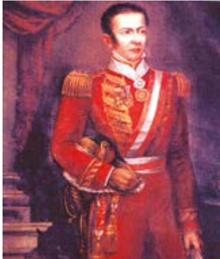
Jose de la Riva Agüero Sanchez Boquete, presidente de la República.