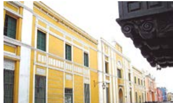
El Colegio Nacional de San Juan cumplirá 168 años de vida institucional.

El obispo Charún fue también presidente del Congreso de la República en 1839. Además, tuvo el sagrado deber de promulgar, en ese mismo año, la denominada: "Constitución Política del Perú 1839" dada en la sala de sesiones del Congreso de Huancayo, el 10 de noviembre. El poder legislativo en