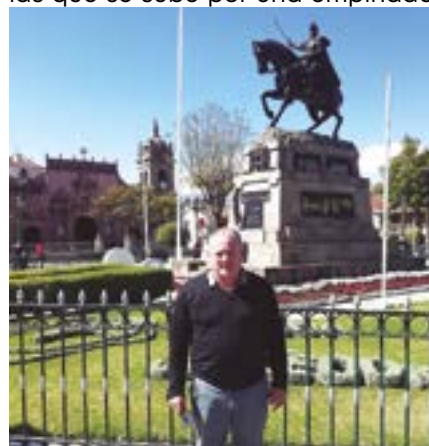
Estatua del Mariscal Antonio José de Sucre.

Continuamos nuestro periplo por la plaza de armas: al medio, la estatua del Mariscal Antonio José de Sucre luce altiva y distinguida. A un lado, la majestuosa catedral con sus dos torres-campanario a las que se sube por una empinada