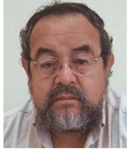
El reconocido arqueólogo, Wálter Alva Alva, descubridor de la famosa Tumba del Señor de Sipán, cursó sus estudios en el glorioso y prestigioso colegio San Juan.

gracias al apoyo del ex recordado congresista y exalumno sanjuanista, Ramón Kobashigawa Kobashigawa y la ex congresista Rosa María Bartra Barriga, ambos representantes por el departamento de La Libertad.