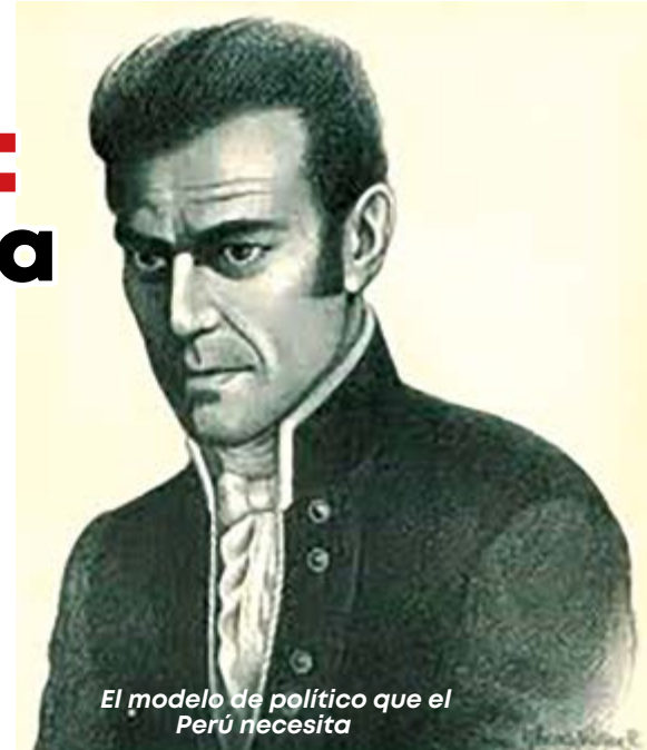
El modelo de político que el Perú necesita

En esta hora crucial en que vivimos los peruanos promovida por elementos extremistas, y, ante la carencia de políticos idóneos que defiendan nuestra Democracia emerge la imagen de un líder huamachuquino, de quien recordamos hoy sus 236 años de su natalicio.