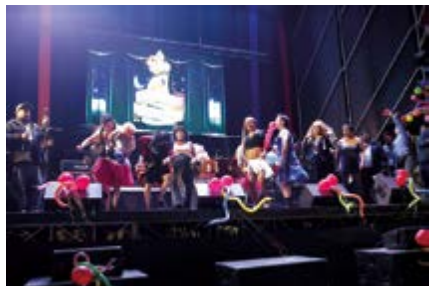
Concurso de las plañideras, que lloran por el Rey Momo.

E l escenario de esta celebración se realizó en la plazuela Bolognesi; luego, el festival musical con grupos locales y nacionales. El deceso del Rey Momo se produce después de tres días de jolgorio: comer, beber y estar con varias mujeres. En el velorio se presentarán las viudas del mítico personaje, que da vida a la fiesta, y protagonizarán escenas de dolor y llanto junto al ataúd.