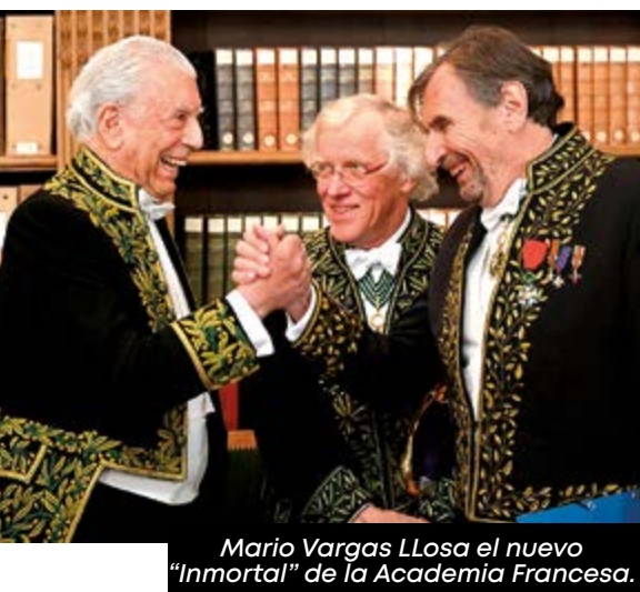
Mario Vargas Llosa el nuevo "Inmortal" de la Academia Francesa.

Miro el país que tenemos y parece ficción que haya podido surgir, aquí, un talento como Jorge Mario Pedro Vargas Llosa, nacido en Arequipa un 28 de marzo de 1936. Que su figura inmensa ilumine lo poco de cultura, lo exigió de civilización que nos va quedando. Hoy Mario Vargas Llosa es el nuevo "Inmortal" de la Academia Francesa, poniendo en alto al Perú.