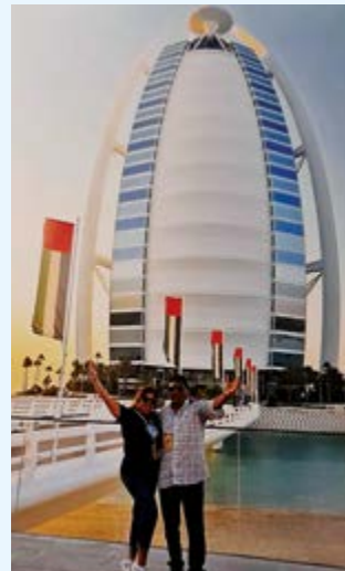
Hermoso hotel 7 estrellas en Burj Al Arab, Dubai