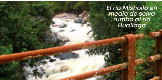
El río Mishollo en medio de selva rumbo al río Huallaga