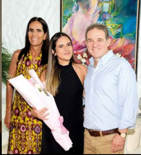
La bella soberana, rodeada de sus queridos padres.