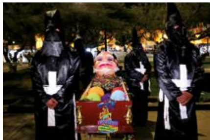
Velatorio de Rey Momo, en Los Baños del Inka,

Las actividades del carnaval continuaron el pasado martes 22 con el velorio de No Carnavalón