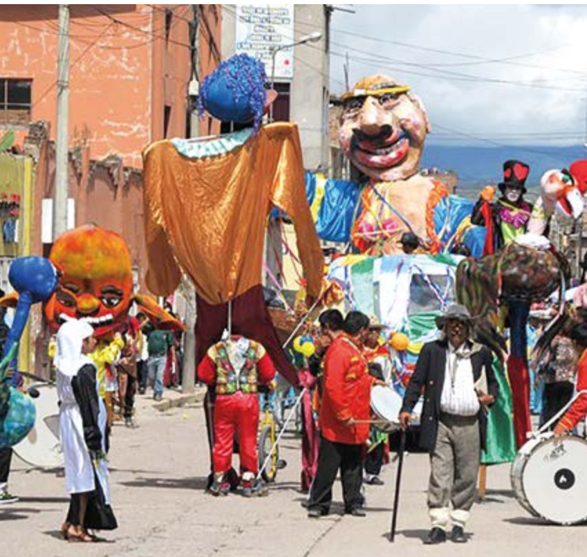
Muñeco del “Ño Carnavalón”