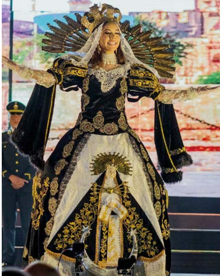
Uno de los trajes con el que participó la Señorita Carnaval.