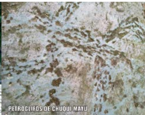
PETROGLIFOS DE CHUQUI MAYU