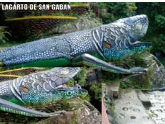
LAGARTO DE SAN GABAN