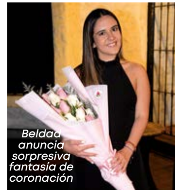
Beldaa anuncia sorpresa fantasía de coronación

Quiero invitar a todos a participar de la fiesta de Carnavales del Club Central, el 11 de marzo de 2023. Le estamos poniendo mucho esfuerzo y estamos seguros que va a ser una ocasión para recordar. ¡Espero verlos ahí!