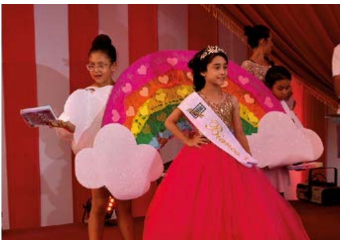
La Beldad de los niños, feliz, luego de recibir la preciada corona y banda, como la soberana del Luau de Huancho. Hoy se prepara para el corso del 4 de marzo.