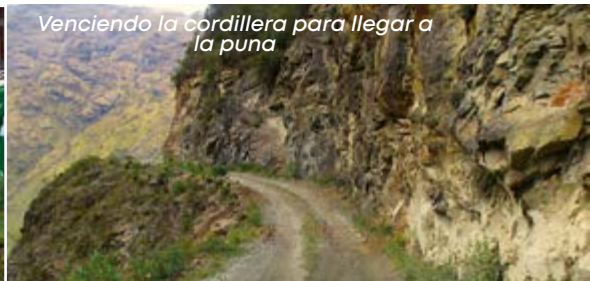
Venciendo la cordillera para llegar a la puna

los 780 msnm. en que se encuentra nuestro destino. Para ello, teníamos que vencer la cordillera superando los 4.000 mts. Gran reto.