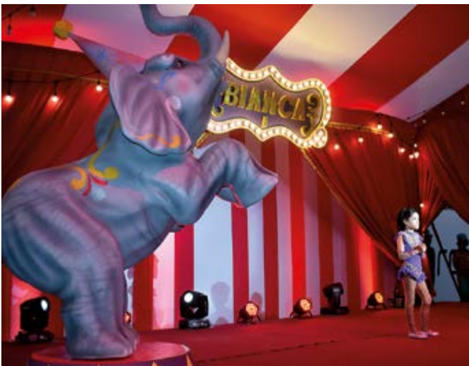
Hermoso elefante,, que lleva en trompa el nombre de Blanca I, y ella lista para hacer piruetas, como una verdadera artista de circo.