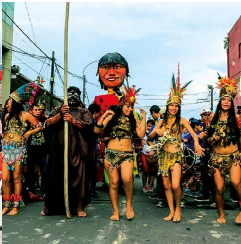
Carnavales en Iquitos (Loreto)

regalos adornados con serpentinas y globos. Y, luego de que un fiestero tumba el palo, se convierte en padrino o madrina y, por ende, asumir el compromiso de reponerlo el otro año siendo por ello motivo de agasajo con un sabroso cuycito asentado con una bebida.