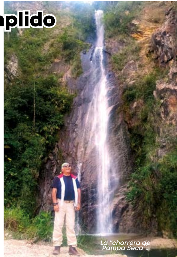
La "chorrera de Pampa Seca"

El Mishollo nos acompañó durante esta larga travesía. Al recibir las aguas de las múltiples quebradas y cascadas su caudal se incrementa hasta hacerlo muy caudaloso. La cascada que más me impresionó la llaman, "Chorrera de Pampa Seca". Se encuentra a una hora antes de Ongón.