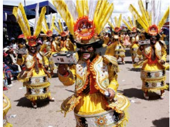
Comparsa carnalera en Puno

Este cuadro humano se repite en febrero de todos los años en las ciudades de la costa e, incluso, de la serranía y la selva de nuestro país por el intenso calor que se soporta. Una circunstancia favorable para bañarse con mayor frecuencia o para dejar que nos mojen por las calles porque: "Llegaron los carnavales" y... "Los carnavales tienen la culpa". Sí, a mediados de febrero y primeros días de marzo es tiempo de carnavales y, por ende, es el mes de los globos con agua, del pintarrajeo, de los polvitos de talco y... a veces de yeso. Llegó el mes de la fiesta de los carnavales o también llamado carnestolendas. Llegó el momento de adornar la altura de las calles con papeles de vistosos colores y el momento del paseo del muñeco "No carnavalón". Es decir, llegó el momento de relajarse, de