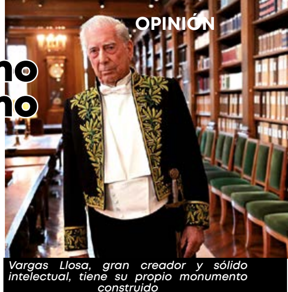
Vargas Llosa, gran creador y sólido intelectual, tiene su propio monumento construido

Los medios de comunicación, en especial la televisión, han vuelto a exhibir el oscurantismo que los impregna y no han dado la cobertura que merece la vigencia continental de Vargas Llosa. Y en las redes sociales ha existido un festival de iletrados cuestionando al más grande escritor peruano