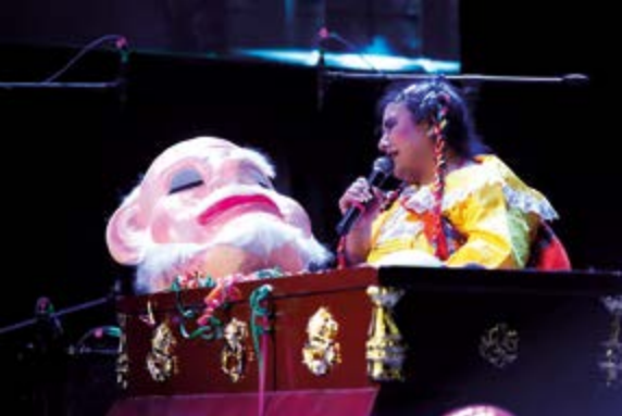
El Rey Momo, en el féretro, donde una de sus viudas le canta las famosas coplas cajamarquinas.

Toledo tiene una orden de prisión preventiva, y cuando llegue al país podría ser internado en un penal.