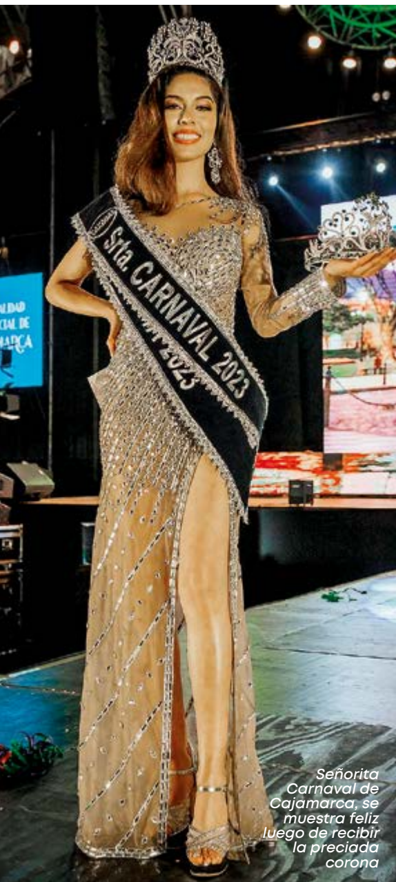
Señorita Carnaval de Cajamarca, se muestra feliz luego de recibir la preciada corona