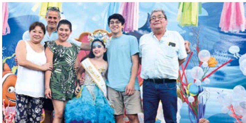
La linda soberana de los niños, junto a sus queridos abuelos, padres y hermano.

¿Cuál es tu nombre y apellidos completos? ¿Cuándo