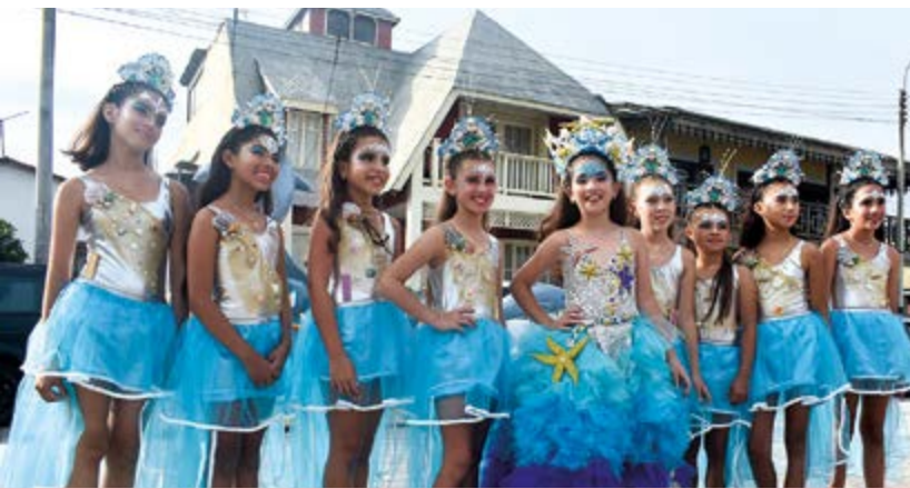
Kamila I, rodeada de su corte de honor