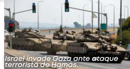
Israel invade Gaza ante ataque terrorista de Hamás.

dispersión de su población por todos los países del mundo, acción represiva que no los dividió ni desapareció, pues tenían como cordón umbilical su raza y su religión, el judaísmo, que fueron como su ADN indisoluble de identificación personal y colectivo. Sin embargo, un hecho que marcó terriblemente con sangre su historia ha sido el desprecio racial de que han sido objeto, lo que motivara la cruel represión de parte del demente líder alemán, Adolfo Hitler, que motivado por su obsesión ideológica de la superioridad de la raza blanca los persiguió y tomó prisioneros asesinando hasta 6 millones de judíos en un acontecimiento histórico condenado por la comunidad internacional conocido como el "holocausto".