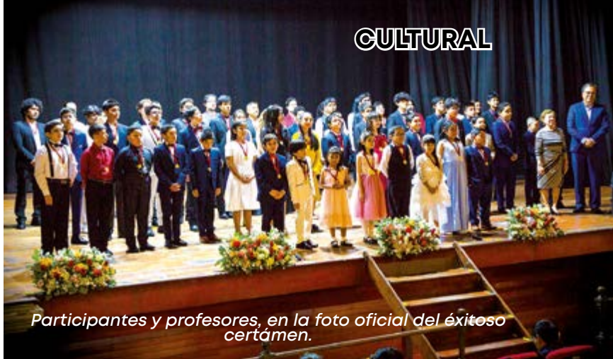
Participantes y profesores, en la foto oficial del exitoso certámen.