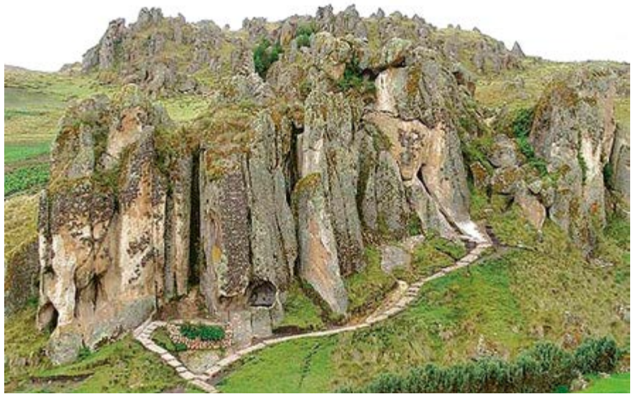
Cumbe Mayo, hermoso legado de nuestros antepasados.

En conclusión, Cajamarca posee un importante patrimonio cultural material e inmaterial que explican nuestra historia y los comportamientos actuales manifestados mediante nuestras tradiciones. Los atractivos y recursos turísticos merecen seguir siendo investigados y establecer un plan de desarrollo sostenible en el que se proteja el patrimonio