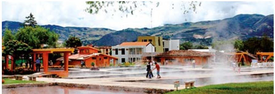
Baños del Inca, atractivo sin precedentes de Cajamarca