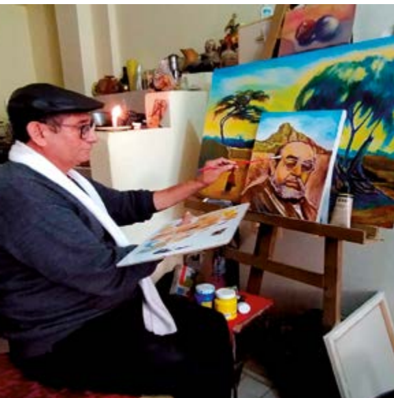
El artista Gil Iparraguirre, con sus pinceladas, pintando al célebre y reconocido arqueólogo Walter Alva Alva

Obras pictóricas de valor histórico y cultural de La Libertad serán plasmadas por el artista Gilmer Gil Iparraguirre.