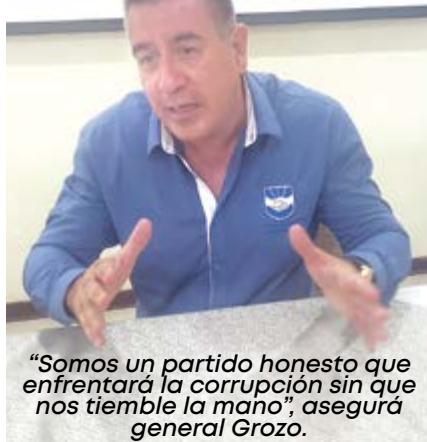
“Somos un partido honesto que enfrentará la corrupción sin que nos tiemble la mano”, aseguró general Grozo.

Nuestra misión es converger, no confrontar. Pues precisamente la confrontación entre peruanos nos ha llevado al caos. En este sentido,