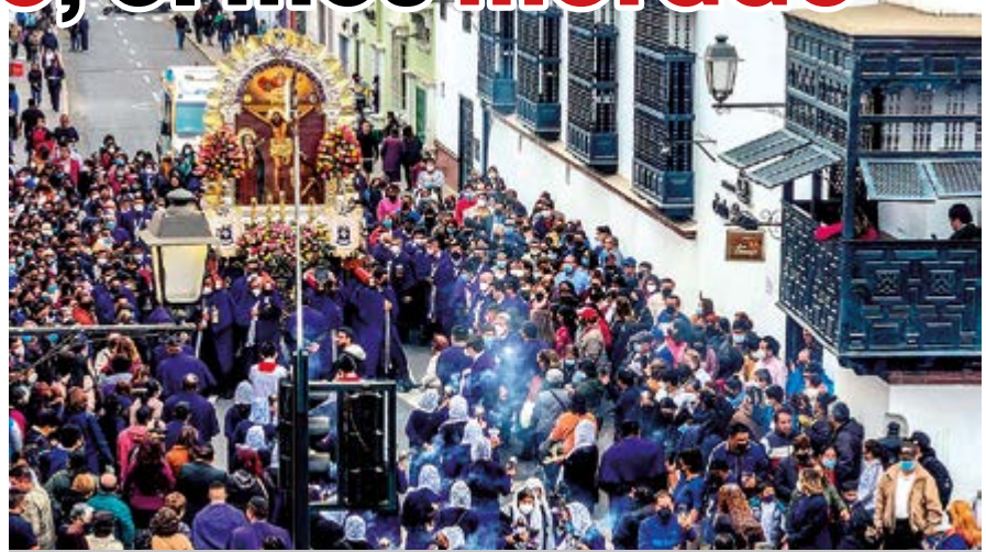
La sagrada imagen en su recorrido hacia la Plaza Mayor.

¿Cómo nació esta fiesta tradicional de la devoción? Conozcamos más sobre este recorrido procesional y su historia reciente en Trujillo.