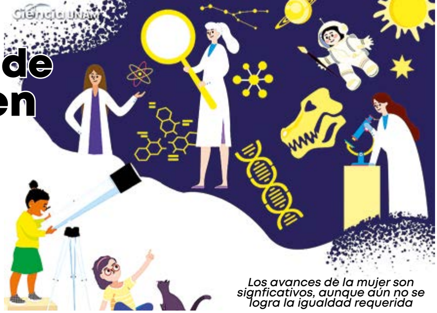
Los avances de la mujer son significativos, aunque aún no se logra la igualdad requerida

Un repaso por el papel que han venido cumpliendo ellas en nuestro país, en vísperas de la conmemoración de la no violencia contra la mujer.