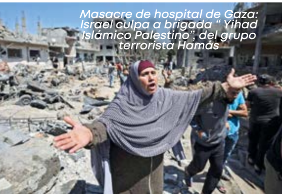
Masacre de hospital de Gaza: Israel culpa a brigada "Yihad Islámico Palestino", del grupo terrorista Hamás

dispersión de su población por todos los países del mundo, acción represiva que no los dividió ni desapareció, pues tenían como cordón umbilical su raza y su religión, el judaísmo, que fueron como su ADN indisoluble de identificación personal y colectivo. Sin embargo, un hecho que marcó terriblemente con sangre su historia ha sido el desprecio racial de que han sido objeto, lo que motivara la cruel represión de parte del demente líder alemán, Adolfo Hitler, que motivado por su obsesión ideológica de la superioridad de la raza blanca los persiguió y tomó prisioneros asesinando hasta 6 millones de judíos en un acontecimiento histórico condenado por la comunidad internacional conocido como el "holocausto".