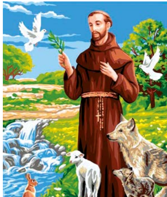
San Francisco de Asís o Taita Pancho

pretendiendo convertir al cristianismo a los gobernantes de Chipre y Egipto, algo que no consiguió. Al regresar a su país crea el primer escenario representativo del pesebre navideño en la campiña del pueblo.