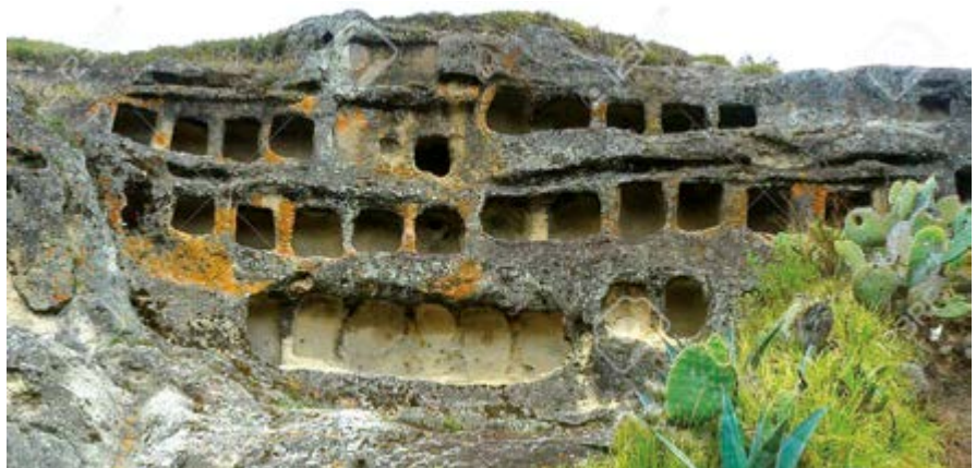
Ventanillas de Otuzco, admirado por los turistas