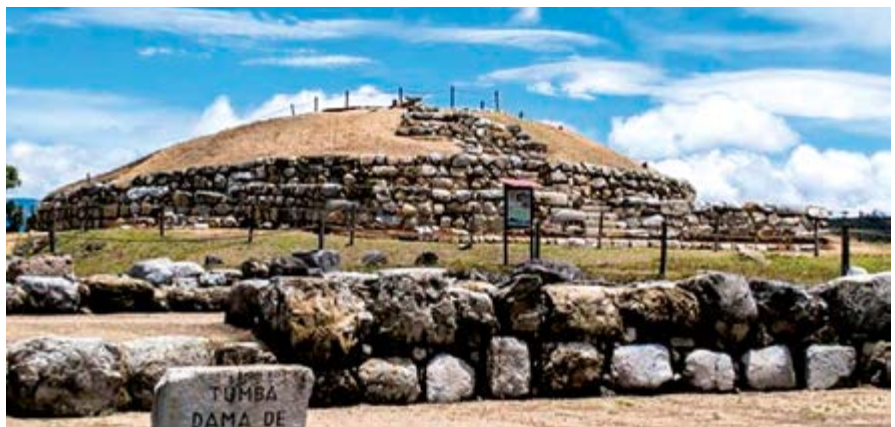
Bello Centro Arqueológico de Pacopampa - Querocoto - Chota

y donde las comunidades locales sean las principales beneficiadas. Pero, que no solo se emplee el patrimonio con un fin económico, sino que su valor sea interiorizado y sensibilizado por las comunidades para que lo respeten y otorguen la