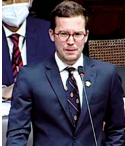
Congresista Alejandro Cavero Alva, presidente de la Comisión de Descentralización,

La Comisión de Descentralización del Congreso aprobó en sesión clave reformas para servicios municipales y protección del patrimonio.