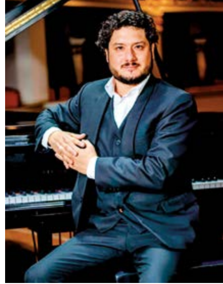
Reconocido pianista, Carlos Arancibia, anuncia IV Festival Internacional de Piano con la participación de artistas de EEUU, Alemania, Venezuela y Perú.

El Festival cuenta con el respaldo crucial de empresarios locales amantes de la cultura, sin cuyo apoyo este evento no sería posible.