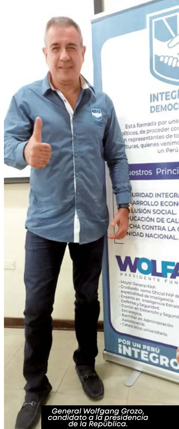
General Wolfgang Grozo, candidato a la presidencia de la República.

Definitivamente hay un malestar de la población en general, por sus