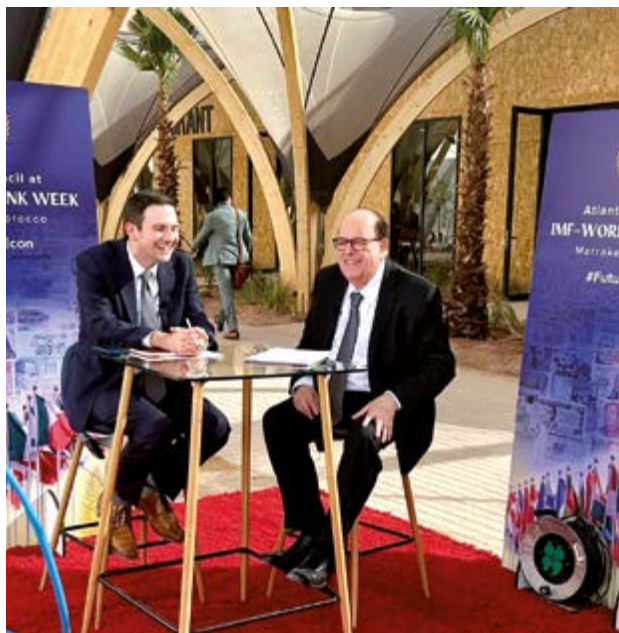
Julio Velarde, presidente del Banco Central de Reserva, en la Reunión Anual del Banco Mundial