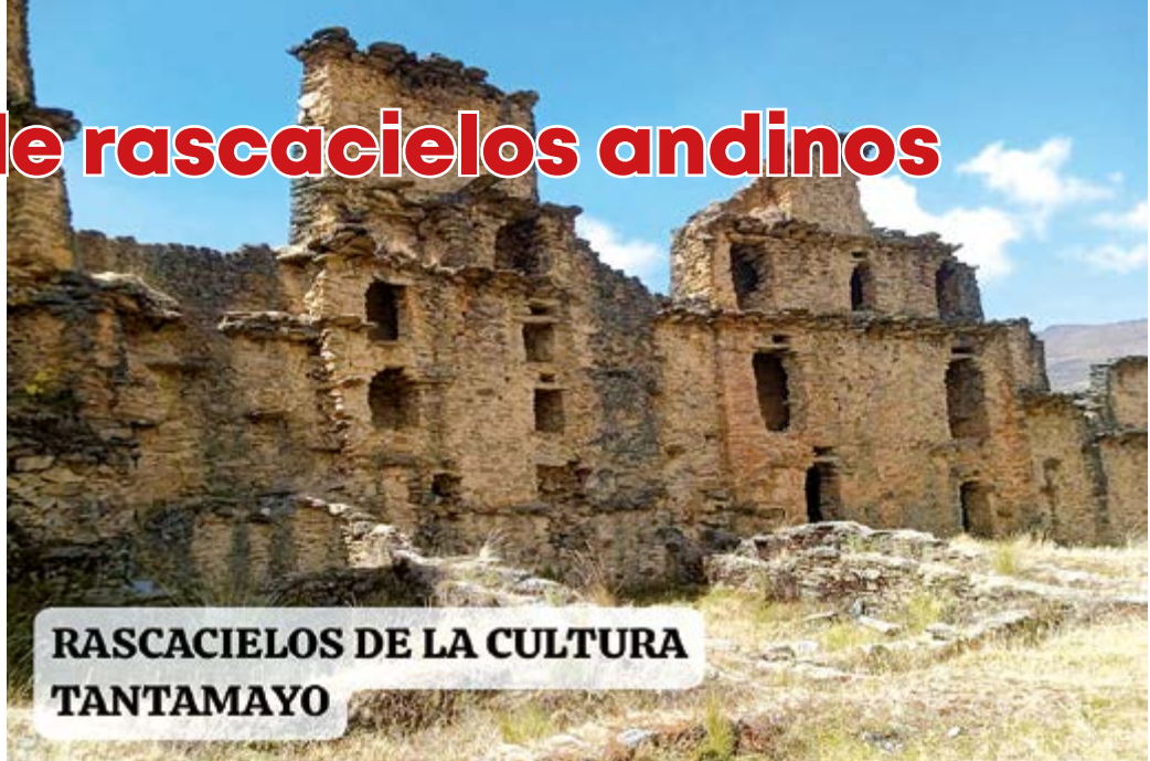
RASCACIELOS DE LA CULTURA TANTAMAYO