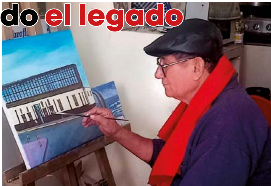
La emblemática e histórica institución educativa, Pedro Mercedes Ureña pintado por Gil Iparraguirre

O bras pictóricas de un valioso valor histórico, cultural y educativo que existen en la región de La Libertad y otros pueblos del norte del país, serán plasmadas por el