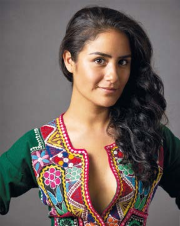
Afamada actriz peruana, triunfa, por su excelente actuación

La sesión de la Comisión de Descentralización también contó con la presentación del contralor Nelson Shack Yalta, quien expuso sobre los fundamentos del Proyecto de Ley 6039-2022-CGR, una iniciativa que busca precisar las capacitaciones ofrecidas por la Contraloría, con el fin de fortalecer la formación de consejeros regionales y regidores municipales. Estas decisiones legislativas representan pasos fundamentales hacia la mejora de los servicios municipales, la preservación del patrimonio cultural y la preparación de las autoridades locales y regionales ante situaciones de emergencia.