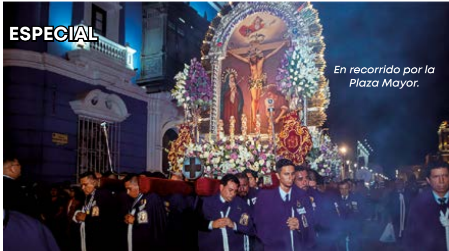
En recorrido por la Plaza Mayor.