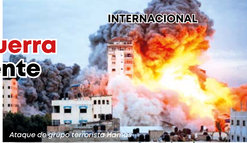
Ataque de grupo terrorista Hamas

Nuevamente el planeta se estremece con el estallido de otra guerra, esta vez entre Israel y Palestina, provocado por organizaciones terroristas. Evento que puede desencadenar en una vorágine bélica de pronósticos reservados.