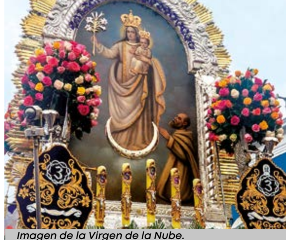
Imagen de la Virgen de la Nube.

Señor de los Milagros, a Tí venimos en procesión tus fieles devotos, a implorar tu bendición. (bis)