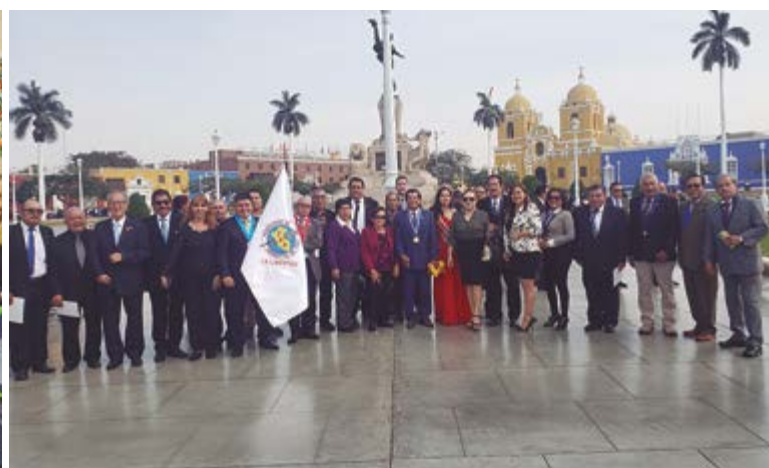
En otro momento, en la foto del recuerdo, en la plaza de armas luego de participar del izamiento de la bandera.