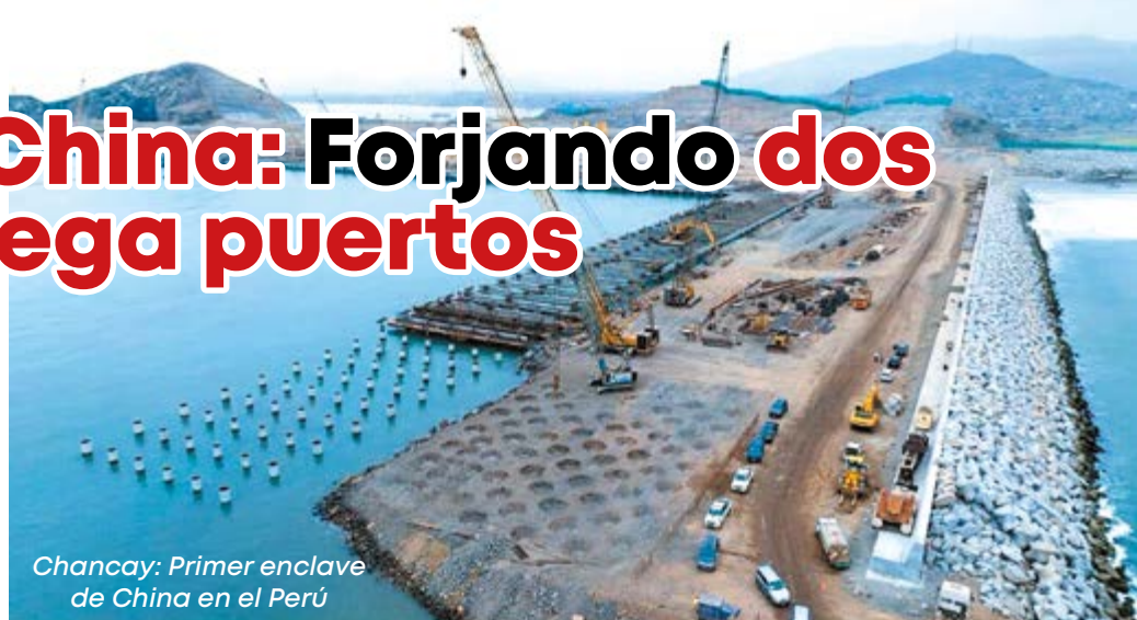
Chancay: Primer enclave de China en el Perú

Como es conocido dos son los grandes bloques geográficos en que se dividen la casi totalidad de países, los llamados democráticos (occidentales) y los socialistas (orientales), bloques marcados ideológica, política y económicamente. También existen países (principalmente los nórdicos) que se colocan al margen. Empero, la participación de los poderosos en los líos bélicos no es por las puras, existe un macro interés, pues muchos de los países pequeños sirven de enclave (pequeños territorios incluidos en su territorio) utilizados como base de dominio geopolítico y económico. Donde no existen conflictos bélicos, los poderosos crean otras fuentes de dominio mundial para ello se valen de la instalación de dichos