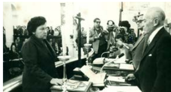
Rosa Estasa Alva, una de las primeras senadoras