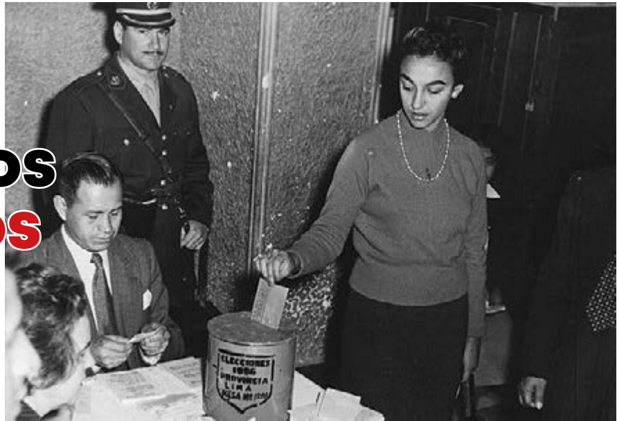
Mujeres votando, por primera vez

Repasemos la historia en el marco del Día de la Mujer: la primera vez que tuvieron derecho a voto y las primeras damas que asumieron cargos importantes.