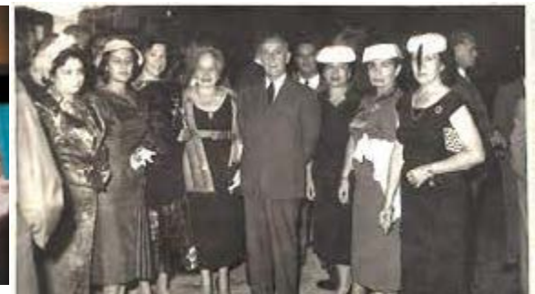
Primeras damas parlamentarias con el presidente Manuel Prado

E n anales históricos sociales y políticos del Perú, antes de constituirse por las Naciones Unidas, el 8 de marzo de 1975 como Día Internacional de la Mujer, las damas peruanas han tenido y tienen participación activa en diversos cargos públicos del país. Haciendo una mirada hacia el Perú, la representación en instituciones públicas y privadas es uno de los progresos notorios. Así como peruanas que destacan en rubros como la ciencia, arte y otras disciplinas que las llevan a ser reconocidas internacionalmente. Pese a ello, la contraparte nos arrastra a unas cifras preocupantes de feminicidios y atentados contra la vida de niñas y adolescentes.