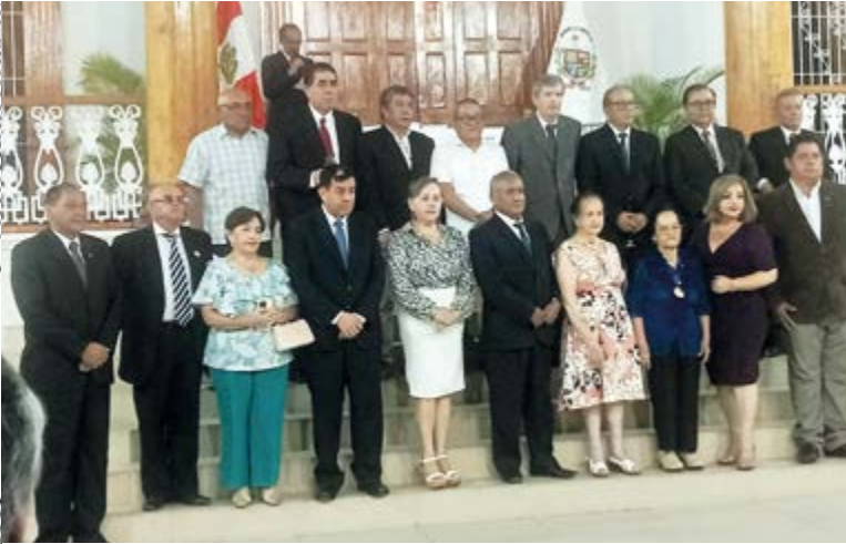
Autoridades, presentes en la ceremonia de homenaje al vate César Vallejo