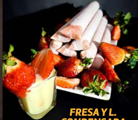
FRESA Y L. CONDENSADA