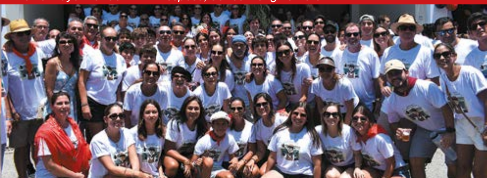
Hombres, mujeres, jóvenes y niños no se perdieron ni un instante de la fiesta española.