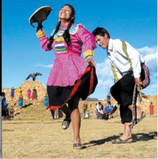
Sin duda la captura de esta toma fotográfica, describe la calidad artística de Alejandro Cerna Bazán.