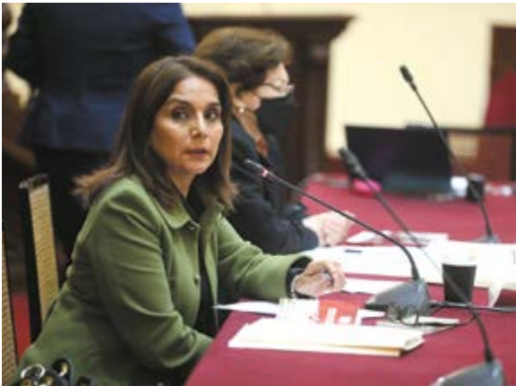
Congresista Patricia Juárez, presidenta de la Comisión de Constitución

de marzo de este año y concluye, el 15 junio. COMPOSICION DEL FUTURO CONGRESO La Cámara de Diputados estará integrado por 130 representantes que tendrán un rol más político.