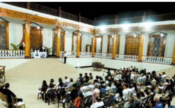
Asistentes al homenaje a Vallejo