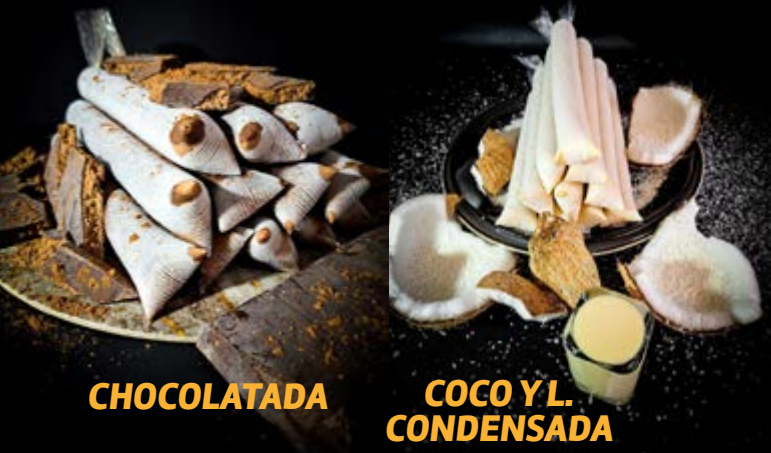
COCO Y L. CONDENSADA

Jr. Alfonso Ugarte 644 Timbre 23 - Centro de Trujillo