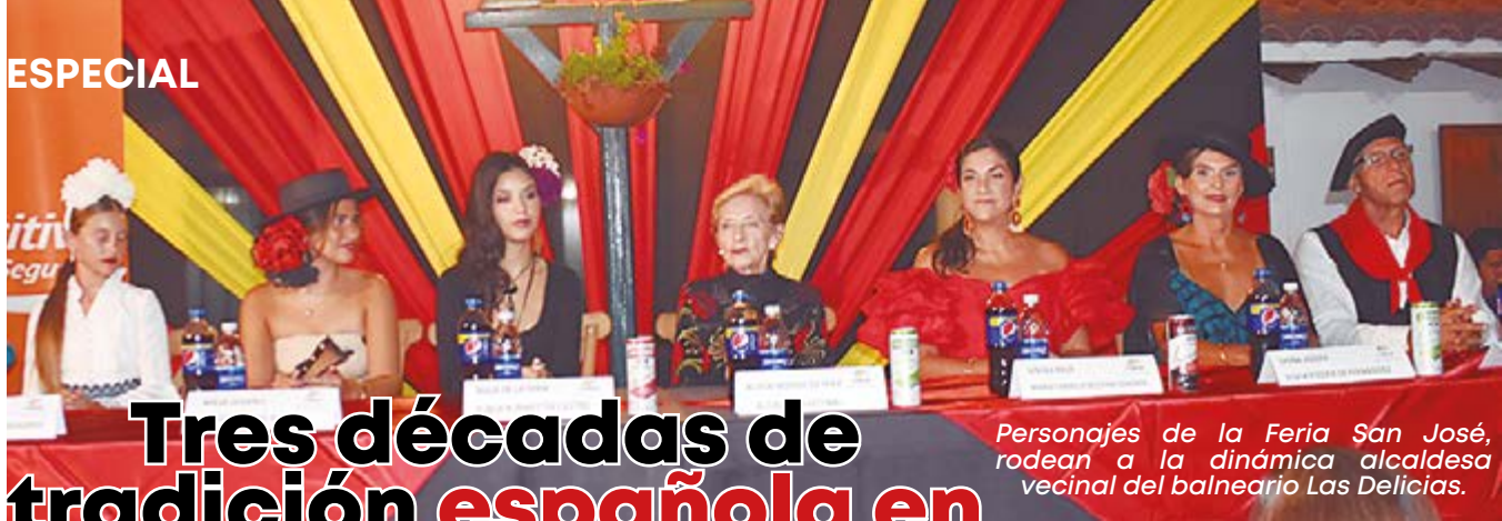
Personajes de la Feria San José, rodean a la dinámica alcaldesa vecinal del balneario Las Delicias.