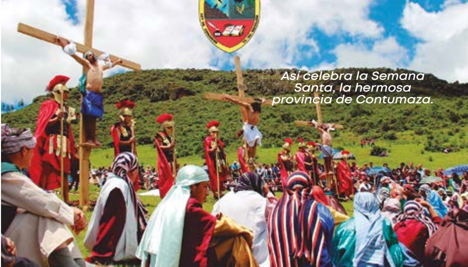
Así celebra la Semana Santa, la hermosa provincia de Contumaza.