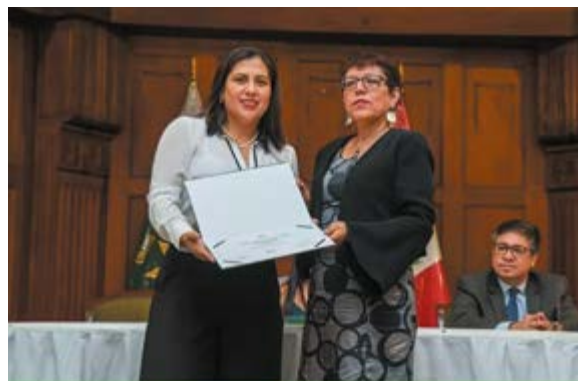
La autora del artículo Ena Carnero, señala que siguen luchando por la igualdad de género.

"La decisión del Congreso del Perú de remover arbitrariamente a dos miembros de la Junta Nacional de Justicia (JNJ) atenta gravemente contra la independencia judicial, el Estado de derecho y la protección de los derechos humanos, señaló hoy Human Rights Watch. La Organización de los Estados Americanos (OEA) debería convocar a una sesión de su Consejo Permanente para abordar los continuos ataques a la independencia judicial en el país", escribió la organización internacional a través de un pronunciamiento público.