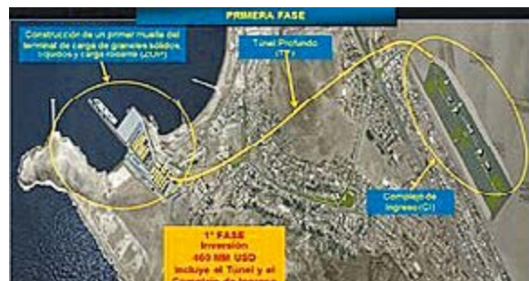
Componentes del mega puerto

Es así que surge la sociedad económica. La empresa minera Volcán aporta el 40% y la empresa china Cosco Shipping Ports el 60% de las acciones con lo que esta empresa se