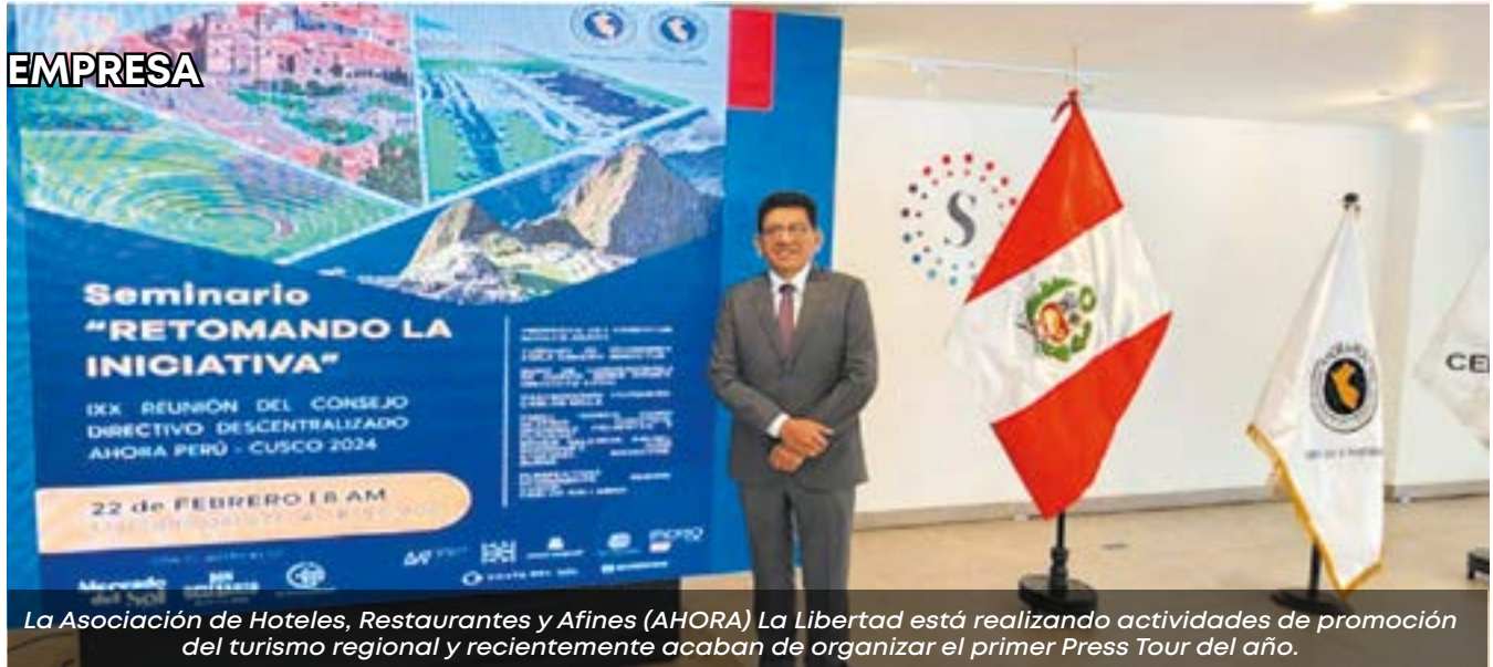
La Asociación de Hoteles, Restaurantes y Afines (AHORA) La Libertad está realizando actividades de promoción del turismo regional y recientemente acaban de organizar el primer Press Tour del año.