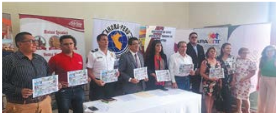
Junto a autoridades y representantes de instituciones y gremios para el primer Press Tour de 2024.

Vamos a continuar con tres Press Tour más con la finalidad que nuestros atractivos turísticos de La Libertad sean conocidos a nivel Internacional.