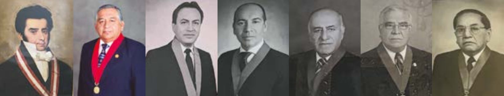
Manuel Lorenzo De Vidaurre y Encalada