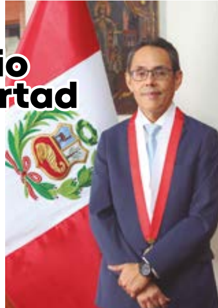
AUTOR: Helder Domínguez Haro Liberteño y Magistrado del Tribunal Constitucional

En el 2001 existían 54 órganos jurisdiccionales y 498 trabajadores (entre jueces y servidores) y la producción se incrementó en 2.6% (procesos judiciales resueltos). Hoy cuenta con 137 órganos jurisdiccionales, en lugares alejados como en el distrito de Parcoy con un Juzgado de Paz Letrado Mixto (se está culminando la instalación del Módulo Básico de Justicia que beneficiará a los usuarios de Pataz, Huayo, Pías y, ciertamente, Parcoy) y un poco más de 1,300 trabajadores (de los cuales 171 son jueces), consiguiendo buenos estándares de producción a nivel nacional, en determinados años se han