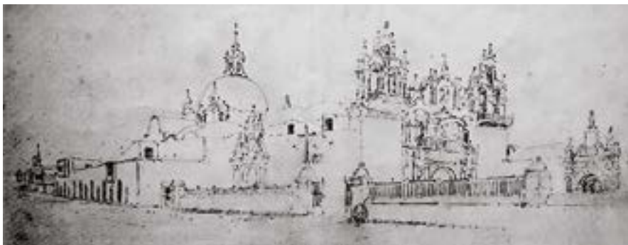
Apunte de Léonce Angrand, viajero y diplomático francés, realizado el 29 de enero de 1839. En este dibujo se puede ver el antiguo muro pretil que delimitaba el atrio del templo de La Merced que a la vez servía de acceso al claustro de los mercedarios, convertido en sede de la Corte Superior de Justicia de La Libertad.