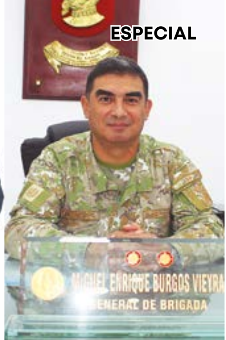
General de Brigada, Enrique Burgos Vieyra, COMANDANTE GENERAL DE LA 32ª BRIGADA DE INFANTERÍA

avances logrados en esta importante institución durante los años de servicio a la ciudadanía. El compromiso es seguir trabajando con empeño, celeridad y vocación de servicio; y que, en esta magna celebración, donde 200 años de historia y justicia enmarcan un hito para nuestra región La Libertad.