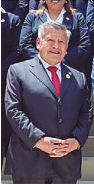
Dr. César Acuña Peralta GOBERNADOR DE LA LIBERTAD: